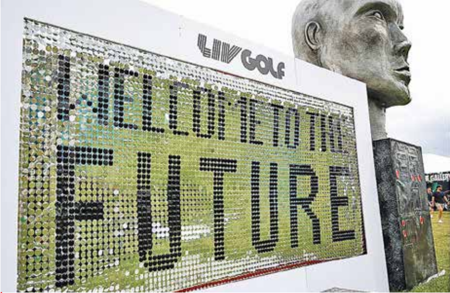
سرمایه گذاری عربستان در مسابقات سری گلف LIV و تلاش برای جذب بازیکنان برتر گلف جهان از جمله فیل میکلسون، سعودی‌ها سعی دارند از طریق جذب شخصیت‌های مشهور جهان تصویر رسانه ای خود را بهبود بخشند

یکی از این برنامه‌ها یک پیشنهاد ۱۰۹ صفحه‌ای را شامل می‌شد که در ژوئن امسال به ثبت رسیده و در حقیقت ناظر به اجرای یک کمپین پنج‌ساله در حقیقت از کارزار تبلیغاتی عظیم عربستان سعودی برای ساختن تصویری دروغین و جعلی از خودش به عنوان «کشوری مدرن، پیشرو، توریستی و جذاب» پرده برمی‌دارد. آنها یکی از گران‌ترین برنامه‌های تبلیغاتی دی سی را استخدام کرده‌اند. محتوای این برنامه به گونه‌ای برنامه‌ریزی شده که سعودی‌ها