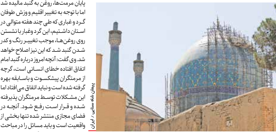
تپه‌های سفید، شیراز، ایران

ایسنا- صادق ضیاییان ، رئیس مرکز ملی پیش‌بینی و مدیریت بحران مخاطرات وضع هوا با بیان اینکه هشدار را پیش از وقوع پدیده‌های جوی صادر و به تمام دستگاه‌های اجرایی ابلاغ می‌کنیم، گفت: وقوع سیل در استان فارس نیز پیش‌بینی و در هشدار هواشناسی به‌طور مفصل به آن پرداخته شده بود.