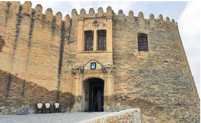
مرمت ها پیش از این به تم کشیدگی دیوارهای قلعه منجر شده بود

اندیک دانشجوی دکترای مهندسی محیط زیست با گرایش منابع آب از دانشگاه تهران هم به کمبود آب در جنوب شرقی ایران، مسأله خشک شدن تالاب هامون و اثرات زیان بار آن بر سلامت جوامع محلی چه در ایران و چه در خود افغانستان می‌پردازد و به رسانه‌ها می‌گوید: «اگر خورستان ایران سالیان سال از پس توسعه‌های آبی ترکیه و خشک شدن تالاب‌های میان‌رودان آماج ریزگردها بوده است و با مشکلات ناشی از آن نیز که بخشی قابل توجهی از آن در خاک خود افغانستان قرار دارد همین رهاورد را نه تنها برای شرق ایران که برای بخش‌هایی از آن کشور نیز در پی خواهد داشت. رهاوردی که در کوتاه‌مدت منجر به افزایش بیماری‌های تنفسی، روی،