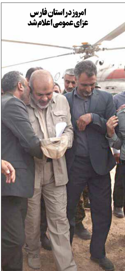
امروز در استان فارس عزای عمومی اعلام شد

رئیس‌جمهور در اجلاس رایزنان فرهنگی جمهوری اسلامی: حمایت فرهنگی از ایرانیان خارج کشور از مهم‌ترین مأموریت‌های شما است