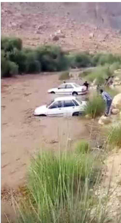
اولین تصاویر منتشر شده از لحظه آغاز وقوع سیل در رودخانه رودبال