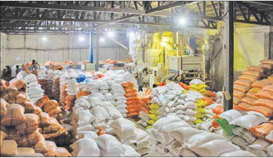
عکس: بازار فوم

همین امر سبب شده که هم اکنون انبارهای مواد غذایی و محصولات کشاورزی کشورمان پر از کالاهای اساسی شود، این در حالی است که بسیاری از کشورهای جهان هم اکنون به دلیل شیوع بیماری کرونا، خشکسالی گسترده در جهان و وقوع جنگ اوکراین و روسیه (دو کشور بزرگ در زمینه تولید محصولات کشاورزی و غذایی) با بحران امنیت غذایی روبه رو هستند. به طوری که ایران با تولید سالانه حدود ۱۳۰ میلیون تن محصول کشاورزی یکی از بزرگترین تولیدکنندگان محصولات