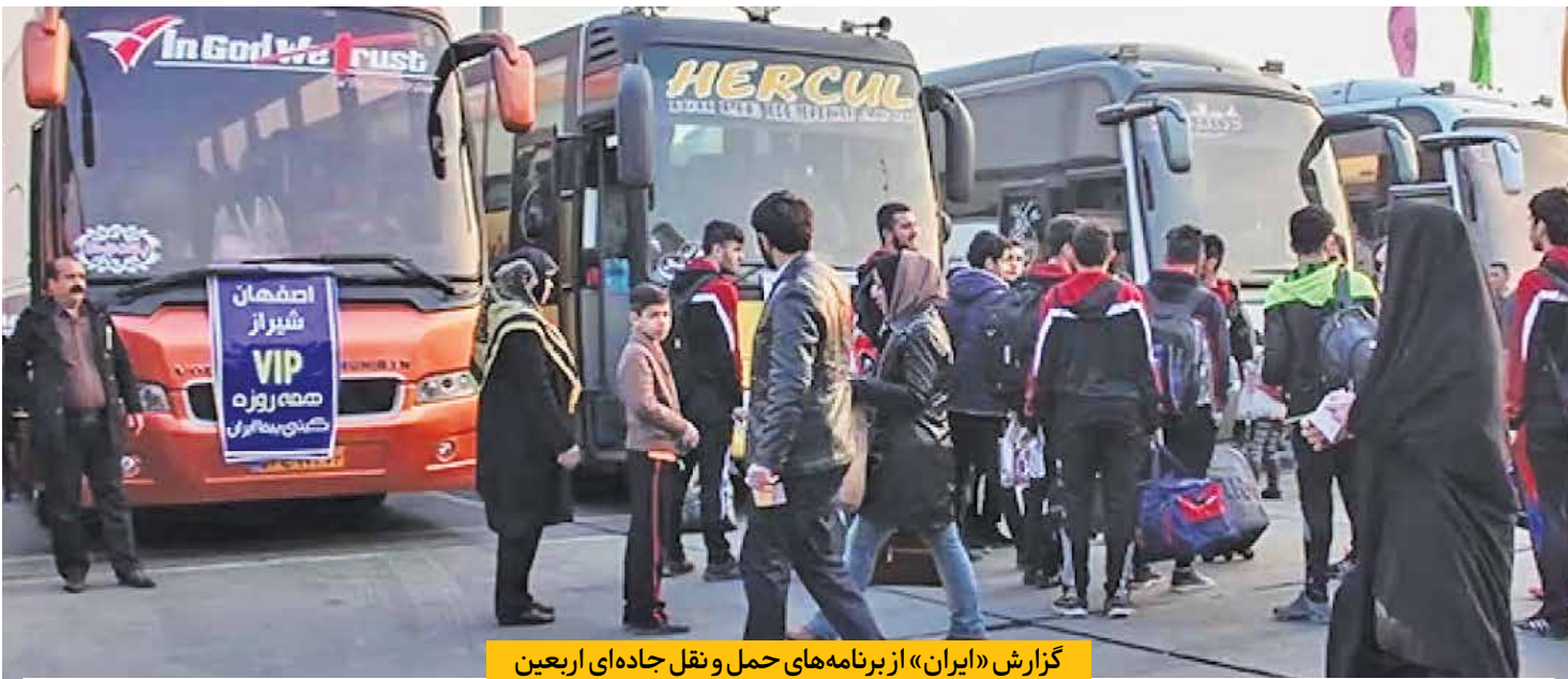
گزارش «ایران» از برنامه‌های حمل و نقل جاده‌ای اربعین