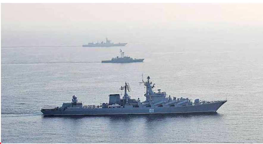
رزمایش دریایی مشترک ایران، روسیه و چین در اقیانوس هند در سال ۲۰۲۲

روابط عربستان و آمریکا اما همچنان تداوم دارد، حتی در این شرایط که اوکراین درگیر جنگ شده و توافق