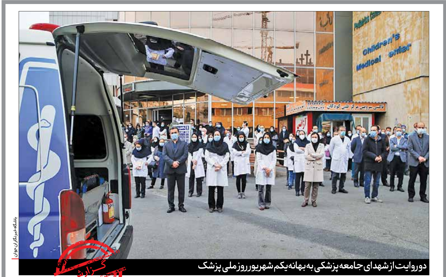
دورویات از شهدای جامعه پزشکی به بهانه یکم شهریور روز ملی پزشکی