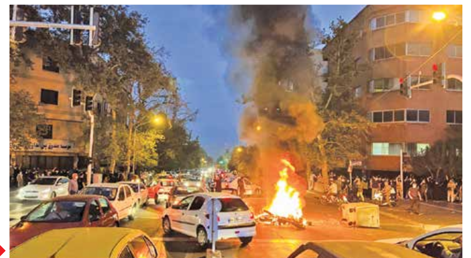
تخریب خودروهای نیروی انتظامی در مشهد از سوی آشوبگران در شب گذشته