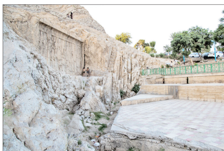
▲ خشک شدن آب چشمه علی