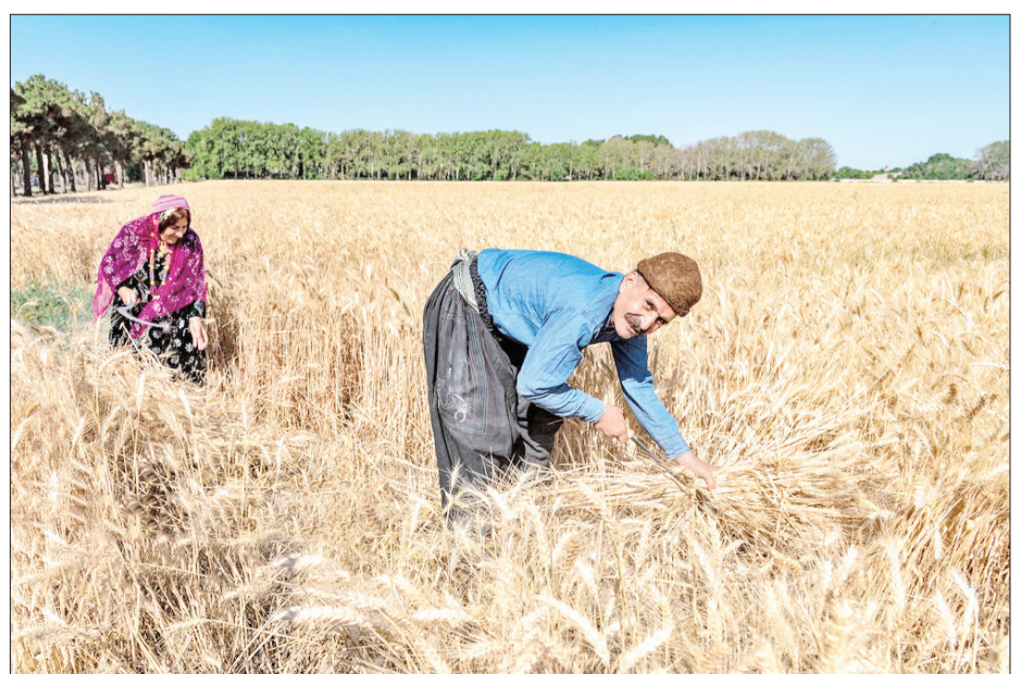
▲ جشن برداشت گندم - کرج