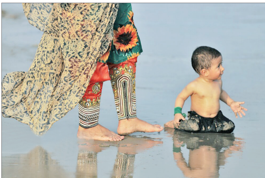
▲ ساحل خلیج فارس