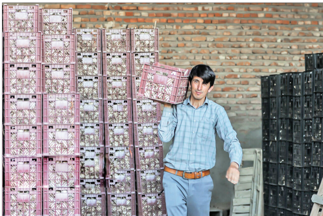
▲ کارگر کشاورز در تیمورلو - آذر شهر