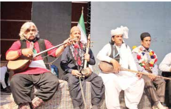
جشنواره برخوردار است.

مجموعه مستند «خبریه اشرف» به تهیه‌کنندگی و کارگردانی مجید نقرشنی روایتی از فساد مالی سازمان مجاهدین خلق به آنتن شبکه مستند برمی‌گردد. سوزه اصلی این مجموعه به ۴ سال پیش برمی‌گردد که اسناد آزاد شده آرشیو ملی بریتانیا پرده از راز بزرگی درباره فساد مالی سازمان مجاهدین خلق برداشت. بخشی از این اسناد ۶ هزار برگه به مؤسسه خبریه‌ای به نام «ایران آید» (Iran Aid) مربوط بود که مشخص شد این مؤسسه خبریه پوشالی و محلی برای کلاهبرداری و انتقال پول از اروپا به عراق و برعکس است. مؤسسه‌های در واقع پوششی برای فعالیت‌های مالی سازمان مجاهدین خلق بود. مجموعه مستند ۱۲ قسمتی «خبریه اشرف» شنبه تا پنجشنبه ساعت ۱۹ از تلویزیون پخش می‌شود و تکرار آن نیز روز بعد ساعت ۸:۲۰ است. // روابط عمومی