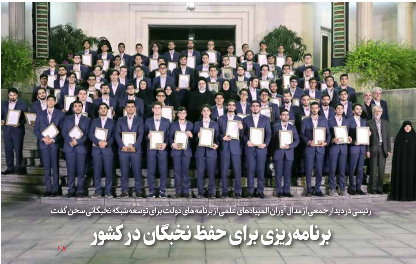
رئیس‌دی‌در دیدار جمعی از مدال‌آوران المپیادهای علمی از برنامه‌های دولت برای توسعه شبکه نخبگانی سخن گفت

«کنترل نوسانات اقتصادی»، «سرمایه‌گذاری و اشتغالزایی» و «مبارزه با فقر و استقرار عدالت» محور بسته‌های اقتصادی دولت