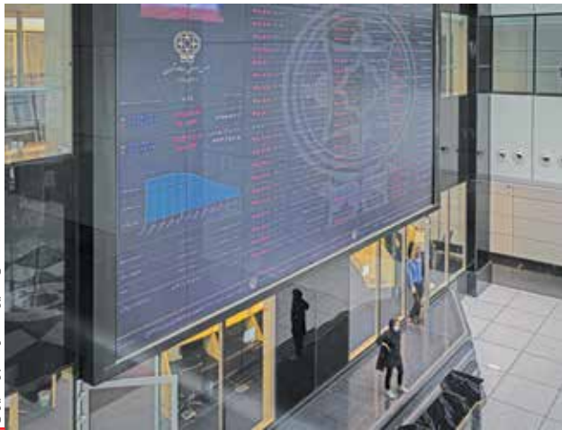
تابلوی معاملات بورس تهران

در جریان معاملات دیروز، گروه های خودرو، فلزات اساسی و استخراج کانه های فلزی بیشترین تأثیر منفی را بر شاخص به ثبت رساندند