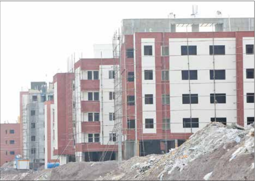
علی حسینیور ایران