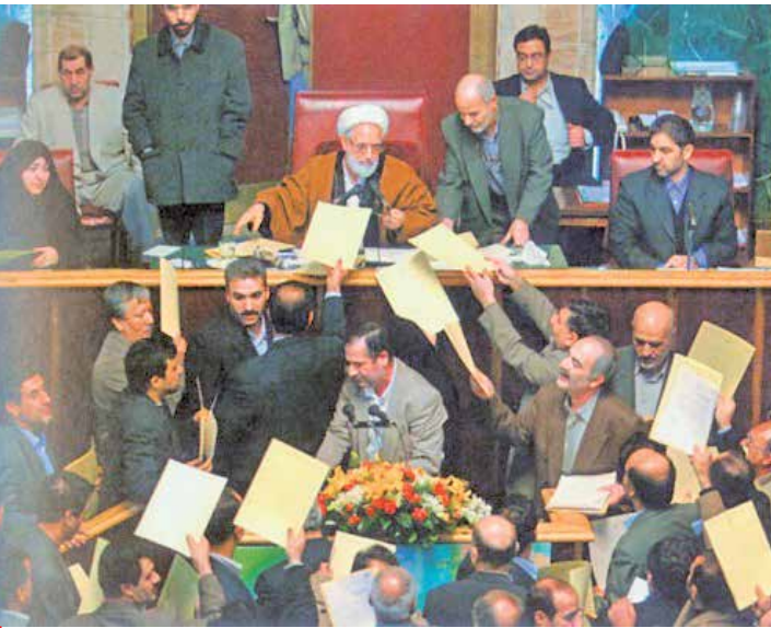
مجلس بر حاشیه ششم

آنها در این نامه غیرمنصفانه خود به رهبر معظم انقلاب با حمله به جمهوری اسلامی ایران و متهم کردن حاکمیت به اختناق، سرکوب، انحصارطلبی و منزوی کردن کشور خط و نشان