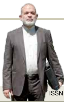
وزیر کشور تشریح کرد

حضور هسته‌های سازمان یافته در ناآرامی‌های اخیر