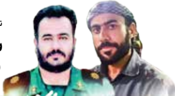
توسط اغتشاشگران صورت گرفت

حضور هسته‌های سازمان یافته در ناآرامی‌های اخیر