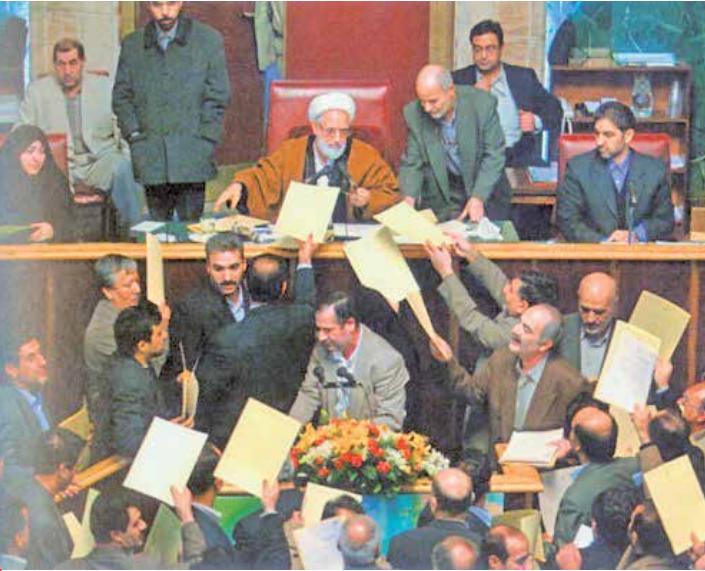
مجلس بر حاشیه ششم

به طور کلی هدف از زیر سؤال بردن دستاوردها، قمیم نشان دادن فرآیندهای علمی در جمهوری اسلامی ایران و القای این مسئله است که در غیاب غرب، ایران به تنهایی نمی‌تواند به چنین دستاوردهایی نایل شود و برای رفع نیازهای خود، مجبور است پذیرش قواعد مورد نظر دشمنان نراند. در این مسیر،