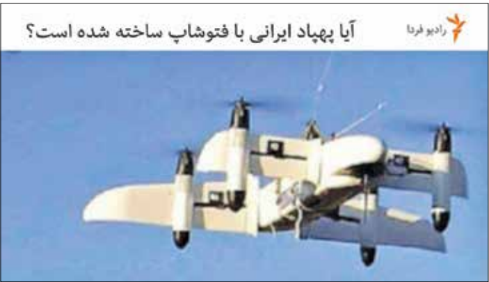
یک طی دهه گذشته رسانه‌های امریکایی برای انکار قدرت پهپادی ایران تلاش می‌کردند |

رهبر معظم انقلاب در سخنرانی روز گذشته خود به همین تبلیغات که سابقه‌ای طولانی دارد اشاره کرده و با بیان خاطره‌ای از امام خمینی (ره) فرمودند: «از اوایل انقلاب اسلامی غربی‌ها در تبلیغاتشان این جور وانمود می‌کردند که نظام جمهوری اسلامی که بر اثر انقلاب به‌وجود آمده رو به زوال است، از همان روزهای اول رو به زوال است. گاهی می‌گفتند دو ماه دیگر، گاهی می‌گفتند یک‌سال دیگر، گاهی می‌گفتند پنج سال دیگر، زمان معین می‌کردند. یک عده‌ای هم در داخل متأسفانه حالا یا از روی غفلت، بعضی‌ها هم از روی بدخواهی همین را ترویج می‌کردند. زمان امام یک روزنامه‌ای که اسم نمی‌آورم برداشت یک مقاله مفصلی نوشت به نظرم تیر هه زند از آن تیرهای درشت صفحه اولی که مخصوص این بود که خلاصه نظام در حال فروپاشی است! امام(ره) آن وقت جواب دادند گفتند خوددان در