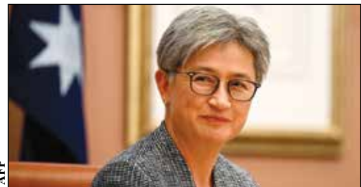
وزیر خارجه استرالیا

اصلاحات و تغییرات دستگاه سیاست خارجی استرالیا در خصوص بیت المقدس به عنوان پایتخت اسرائیل عملاً بر تشکیل دولت رسمی فلسطینی تأکید دارد. در همین خصوص وبه گزارش روزنامه انگلیسی گاردین، وزارت خارجه استرالیا در چند روز گذشته دو جمله را از وبسایت خود حذف کرد که چهار سال پیش بعد از آنکه موریسون، نخست وزیر سابق استرالیا از سیاست جدید کشورش رونمایی کرد، این عبارت‌ها برای اولین بار اضافه شده بودند. در متن جملات حذف شده آمده است: «در راستای این سیاست بلندمدت، استرالیا در دسامبر ۲۰۱۸ قدس غربی را به عنوان پایتخت اسرائیل به رسمیت شناخت، چراکه قدس مقر کنست و بسیاری از نهادهای