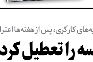
کلیسای کاتولیک در برزیل

در آستانه دور دوم انتخابات ریاست جمهوری برزیل در شرایطی که رقابت میان ژائیر بولسونارو و لولا داسیلوا، رئیس جمهور فعلی و گذشته این کشور بشدت جدی شده، اهمیت جلب آرای مذهبی در دور دوم، کلیسای کاتولیک را به عنوان مهره‌ای اثرگذار وارد کارزار انتخاباتی کرده و سخنرانی برخی شخصیت‌های مذهبی، حتی روزی امیدوی به بولسونارو داده است.