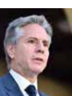
وزیر امور خارجه چین

وزیر خارجه آمریکا در سخنانی مدعی شد، پکن در نظر دارد در دوره ریاست جمهوری «شی جین پینگ» طی یک جدول زمانی بسیار سریع، تایوان را به خاک چین ملحق کند. به گزارش سایت شبکه خبری العالم به نقل از گاردین، آنتونی بلینکن که در اندیشه‌های آمریکا «بنیاد هور» سخن می‌گفت در جریان این نشست این ادعا را بدون ارائه هیچ سندی مطرح کرد و به چین هشدار داد، چنین اقدامی باعث ایجاد اختلاف شدید در اقتصاد جهانی خواهد شد. او که به همراه کاندولیزا رایس در این نشست حضور داشت، ادعا کرد که صلح و ثبات بین چین و تایوان با موفقیت طی دهه‌ها حفظ شده بود اما پکن رویکرد خود را تغییر داده است.