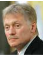
وزیر امور خارجه روسیه

کرملین اعلام کرد که چهار منطقه سابق اوکراینی که ماه گذشته میلادی به روسیه ضمیمه شدند، تحت حفاظت زرادخانه هسته‌ای روسیه هستند. به گزارش ایسنا به نقل از خبرگزاری رویترز، هنگامی که در نشست خبری از دیمیتری پسکوف، سخنگوی کرملین پرسیده شد، آن چهار منطقه‌ای که اخیراً در آنها فراندوم برگزار شد، تحت حفاظت هسته‌ای مسکو هستند یا خیر، پاسخ داد: «تمامی این سرزمین‌ها بخش جدایی‌ناپذیر فدراسیون روسیه هستند. بنابر این محافظت و امنیت تمامی آنها درست مانند سایر بخش‌های روسیه است.» این سخنان در بحبوحه تشدید تنش‌ها در جنگ اوکراین بیان شد و انتظار می‌رود، ائتلاف نظامی ناتو بزودی تمرین‌های نظامی را برای آزمایش آمادگی نیروهای تسلیحات هسته‌ای خود برگزار کنند. ناتو همچنین مدعی شده، انتظار دارد «روسیه هم آزمایش‌های هسته‌ای خود را فوراً آغاز کند.» اما پسکوف این ادعاها را رد و اعلام کرده است هیچ اطلاعی در این خصوص ندارد.