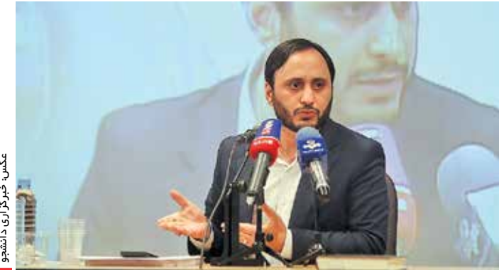
بخش خبرگزاری دانشجو

به حاشیه‌سازی‌های اخیر علیه رئیس‌جمهور با لیخندی ادامه داد: ما که حرف بزیم نمی‌شنوید و کسی که ما را مسخره می‌کند می‌شنوید؛ رئیس‌جمهور در دیدار رهبری داد و گفت: امروز نام او به‌عنوان فرمان مبارزه با یک درصد و این درست بود.