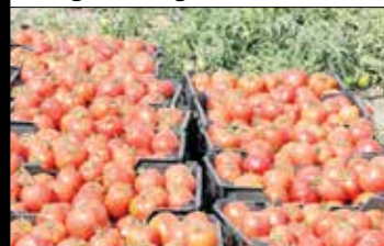
تولید گوجه فرنگی در مزارع کشاورزان استان بوشهر.

پیش بینی می شود ۶۰۴ هزار تن محصول گوجه فرنگی از سطح ۱۱ هزار و ۴۰۰ هکتار اراضی کشاورزی استان بوشهر برداشت شود؛ ۸۰ هزار تن محصول از سطح هزار و ۵۰۰ هکتار از مزارع استان به صورت پاییزه و ۵۱۴ هزار تن از سطح ۹ هزار و ۷۰۰ هکتار در کشت زمستانه و ۱۰ هزار تن از ۲۰۰ هکتار در کشت بهاره در استان بوشهر برداشت می شود.