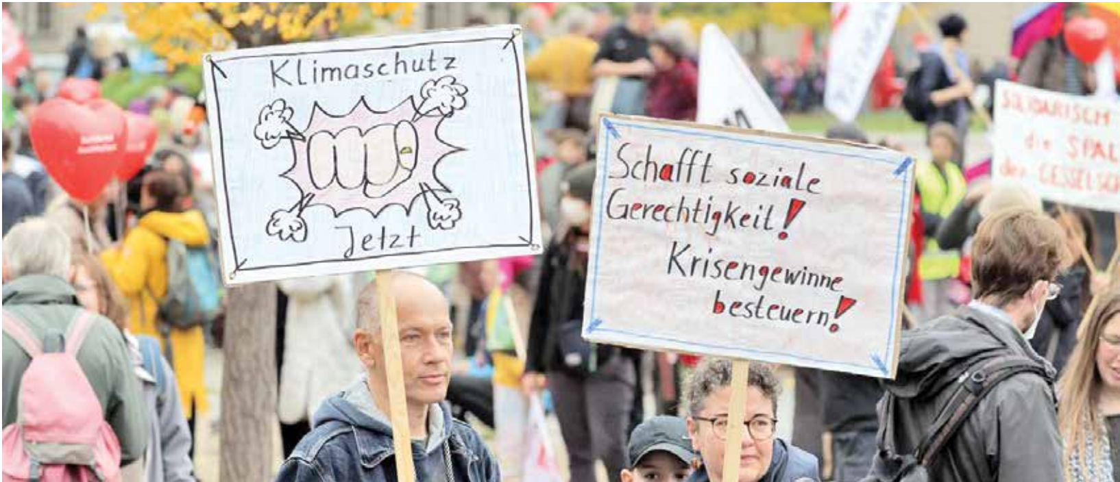
اعتراض گسترده آلمانی ها نسبت به مشکلات کشورشان، روی پلاکارد آنها شعارهایی درباره مطالبه عدالت اجتماعی و ساماندهی قوانین مالیاتی نوشته شده است.

گروه سیاست/ نقش آلمان در تسلیح شیمیایی رژیم صدام و شراکت در جنایات وی علیه ایران، بارها در رسانه های داخلی و بین المللی مورد اشاره قرار گرفته است. بزرگترین، وحشیانه ترین و غیرانسانی ترین اقدام نظامی رژیم بعث عراق در جنگ تحمیلی استفاده از سلاح کشتار جمعی بویژه سلاح شیمیایی بود؛ یکی از این حمله های نیروی هوایی عراق در هفتم تیر سال ۱۳۶۶ با استفاده از سلاح شیمیایی در چهار منطقه کردنشین سردشت از توابع آذربایجان غربی، هزاران مصدوم بر جای گذاشت و از شهری که ۱۲ هزار نفر جمعیت داشت طبق آمار رسمی هشت هزار و ۲۵ نفر مصدوم و از این تعداد ۱۳۰ نفر در همان لحظات اولیه شهید شدند. سردشت نخستین شهری بود که پس از جنگ جهانی دوم در دنیا بمباران شیمیایی شد.