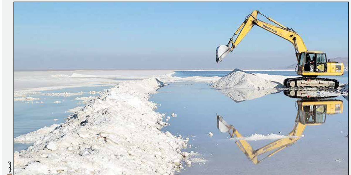
تصویر: محسن مهرعلیزاده رئیس فدراسیون بین‌المللی ورزش‌های زورخانه‌ای و کشتی پهلوانی نشدیم و همچنین تلاش‌ها برای ارتباط با مصطفی پورعلی، مدیرکل دفتر ثبت و حریم آثار، حفظ و احیای میراث معنوی و طبیعی وزارت میراث فرهنگی نیز بی‌ثمر بود.

جواب وزارت نیرو اکتفا نمی‌کنیم بلکه کارشناسان سازمان محیط زیست به طور کامل در روند کار حضور خواهند داشت و حتی آزمایش‌ها هم در آزمایشگاه معتمد سازمان محیط زیست انجام می‌شود.» تا باز این سؤال پیش بیاید که آیا دفتر ارزیابی محیط زیست که باید طبق قانون پاسخ این سؤال را بدهد هیچ پژوهشی روی پروژه نداشته است؟ چرا سازمان حفاظت محیط زیست از انتشار گزارش مطالعات ارزیابی سدچم شیر اجتناب می‌کند و در پاسخ به «عصر ایران» می‌گوید: «این گزارش جزو اسناد رسمی است.» سؤال دیگری هم وجود دارد. چرا وزارت نفت نسبت به وجود چاه‌های نفت در سد چم‌شیر که تعداد آن ۱۱ حلقه چاه اعلام می‌شود، هیچ واکنشی نشان نمی‌دهد؟! باید منتظر ماجرا شده‌اند، سؤال بی‌جواب مانده را پاسخ می‌دهند یا خیر؟