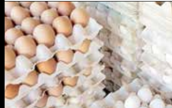
تولید تخم مرغ در مرغداری ها به صورت فله توسط مرغداران فروخته می شود.

پیش بینی می شود ۶۰۴ هزار تن محصول گوجه فرنگی از سطح ۱۱ هزار و ۴۰۰ هکتار اراضی کشاورزی استان بوشهر برداشت شود؛ ۸۰ هزار تن محصول از سطح هزار و ۵۰۰ هکتار از مزارع استان به صورت پاییزه و ۵۱۴ هزار تن از سطح ۹ هزار و ۷۰۰ هکتار در کشت زمستانه و ۱۰ هزار تن از ۲۰۰ هکتار در کشت بهاره در استان بوشهر برداشت می شود.