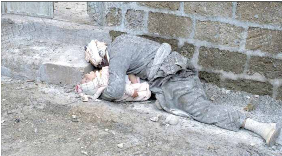
آلمان با تأمین سلاح های شیمیایی، یکی از عوامل اصلی جنایت صدام در کشتار مردم بی دفاع حلبچه بود

وزرای خارجه کشورهای عضو اتحادیه اروپا بویژه آلمان، بسته تحریمی جدیدی را علیه ایران به بهانه مسائل حقوق بشری وضع کرده و درباره تشدید تحریم ها در خصوص ادعای مشارکت ایران در جنگ اوکراین هشدار دادند. چهار کشور انگلیس، آلمان، فرانسه و ایالات متحده