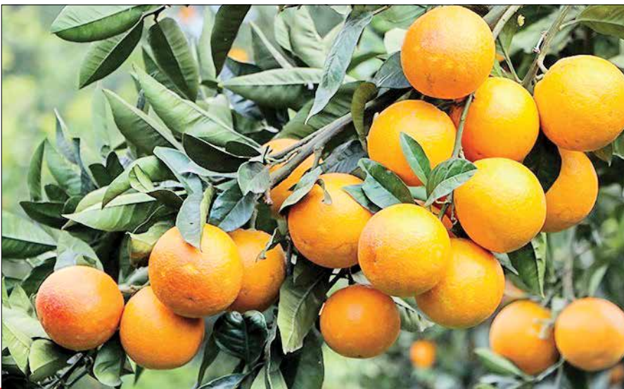
تولید مرکبات در باغ های کشاورزان استان مازندران.

وی ادامه داد: در کنار کاهش تعهدات ارزی، خرید تضمینی مرکبات با همراهی شرکت های تعاون روستایی در دستور کار است تا با اجرای این طرح برای فروش این محصولات کشاورزی استان اقدامات جدی تری صورت گیرد.