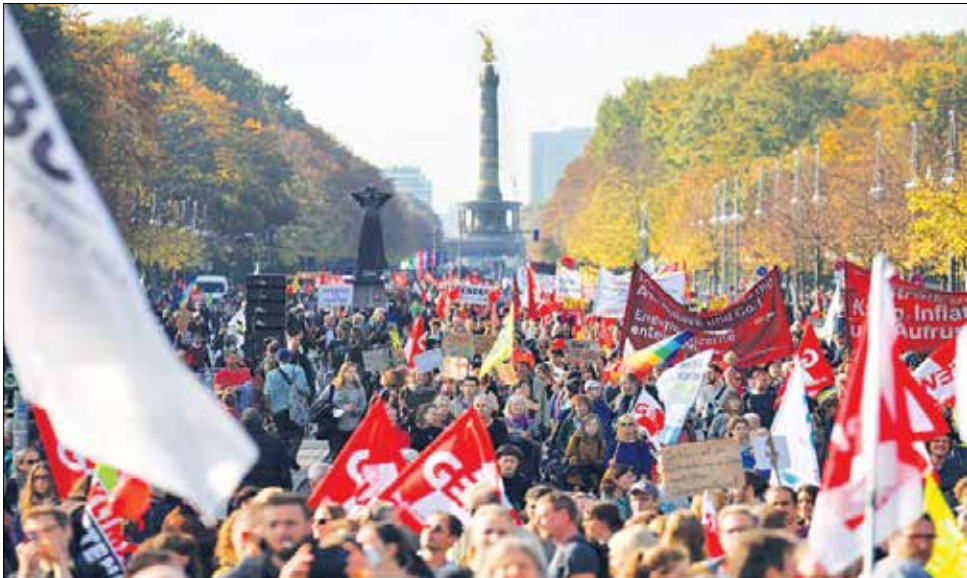
تجمع آلمانی ها در اعتراض به مشکلاتی از جمله تورم و انرژی (۲۰۲۲)

به عنوان ناقضان اصلی توافق هسته ای، قطعنامه ای را در شورای حکام آژانس بین المللی انرژی اتمی پیشنهاد و با فشار سیاسی به تصویب رساندند تا به این ترتیب تحریم های غیرقانونی بیشتر علیه ایران را توجیه کنند. در صورتی که این قطعنامه با انگیزه های سیاسی و فشار کشورهای امریکا و تروئیکای اروپا علیه ایران صادر شد هیچ گونه ارزش فنی ندارد و اقدام کاملاً سیاسی و فاقد وجهت قانونی است. از اقدامات سیاسی داخلی کشور آلمان می توان به تصویب لایحه دولت ائتلافی این کشور، درباره حمایت از اغتشاشگران داخلی برای افزایش فشارها بر جمهوری اسلامی و تعطیلی مرکز اسلامی هامبورگ اشاره کرد. نمایندگان پارلمان آلمان هم در یکی از جلسات خود با صراحت بی سابقه ای علیه رژیم ایران سخن گفتند.