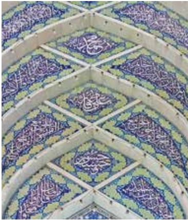
اثر استاد حسین قائمی