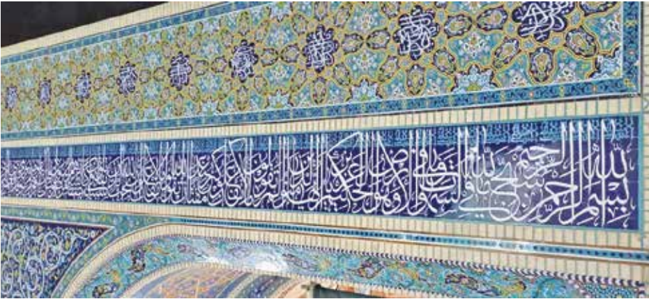
اثر استاد سید محمد حسینی موحد