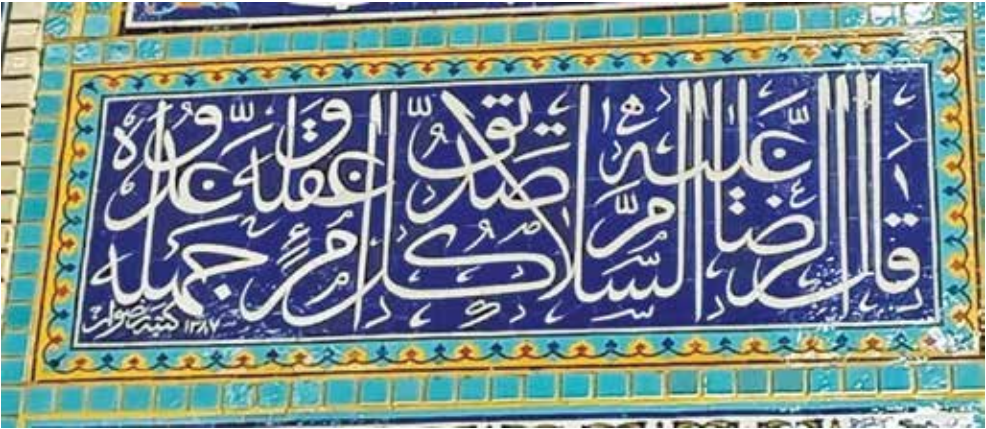
اثر استاد محمد حسن رضوان

سالیان سال این پرچم‌ها باقی ماند و بعد هم در موزه نگهداری شد. یا آن سالی که در مسجد شیعیان مدینه منوره نوشتم آنجا امام جماعتی به نام شیخ عمری داشت که به جرم شیعه بودن شکنجه می‌کردند. در ابتدا که رفتم نمی‌دانست شیعه هستم. به من گفت مرا به جرم نوشتن این کتیبه‌ها شکنجه خواهند کرد. بعد به آثارم نگاه کرد دید در پایان آیه نوشتم‌ام صدق‌الله‌العلی‌العظیم و فهمید شیعه هستم. دست و صورت مرا بوسید و به من آن زمان ۱۰۰ دلار شکنجه شوم. و در آخر هم زیر شکنجه‌های آل‌مسعود به شهادت رسید. اینها توفیقاتی است که با ارتباط معنوی به دست می‌آید. اگر کار استاد صمدی ماندگار شده، استادی که هیچ وقت از طرف هیچ نهادی حمایت نشد، معرفی کنند.