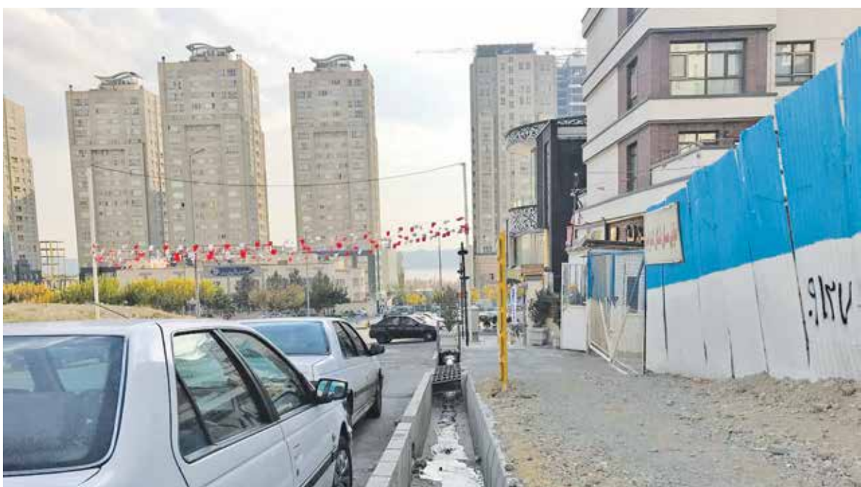
نبرد فاضلاب شهری، زندگی ساکنان منطقه ۲۲ تهران را در هم پیچیده است