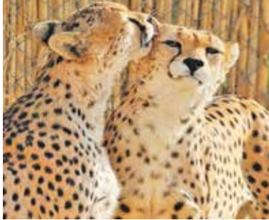
ایران و فیروز