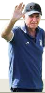
مرد برتغالی امروز از ایران می رود اما احتمالاً بزودی برمی گردد