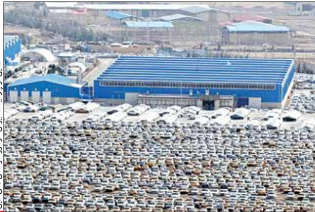
مشاب از پارکینگ ایران خودرو در سال های قبل