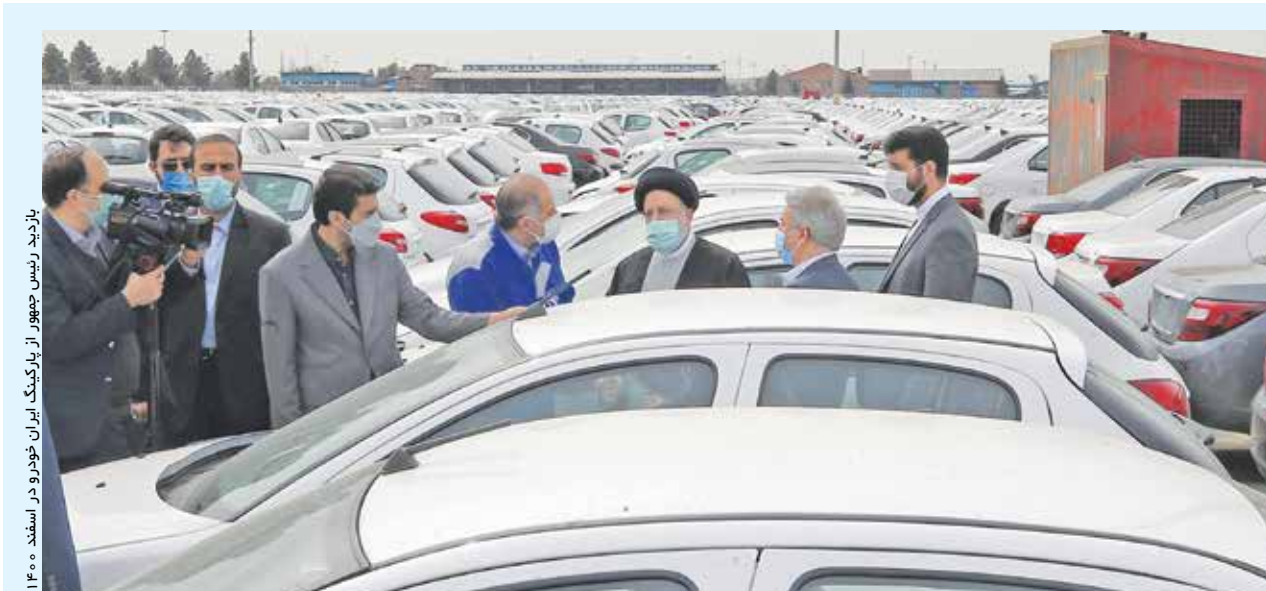
بازدید رئیس جمهور از پارکینگ ایران خودرو در اسفند ۱۴۰۰