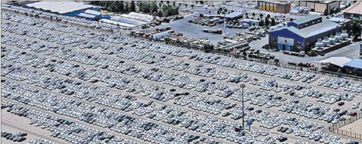
مشاب از پارکینگ ایران خودرو در سال های قبل