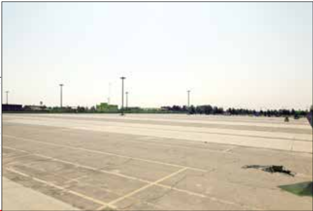
پارکینگ طای ایران خودرو / مهرماه ۱۴۰۱