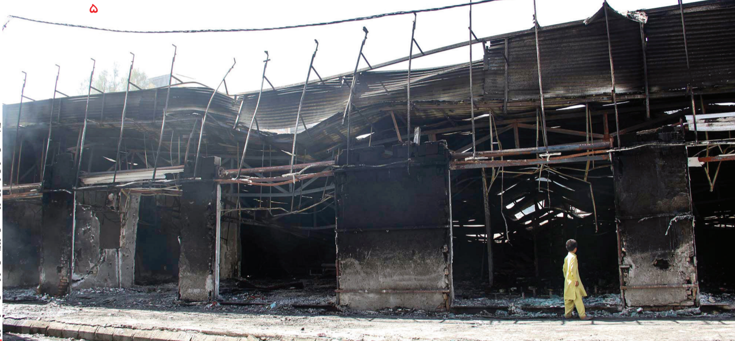
تخریب اماکن عمومی از سوی گروهک های تروریستی در زاهدان - سپهر ماهیان