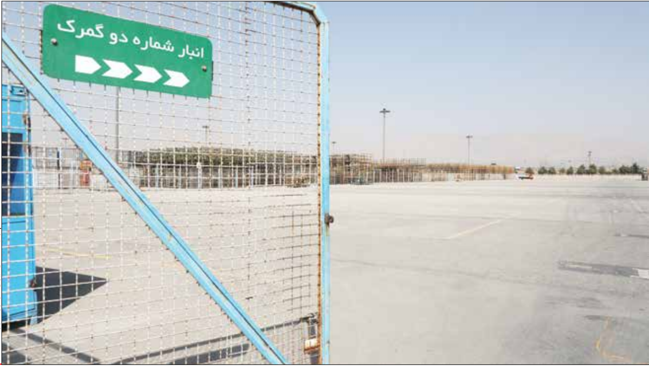
پارکینگ طای ایران خودرو / مهرماه ۱۴۰۱

آینده روشن ایران خودرو در نتیجه‌گیری باید عنوان کرد که با توجه به بازدید سه ساعته‌ای که از ایران خودرو داشتیم، وضعیت نسبت به گذشته بسیار بهبود یافته است. خطوط تولید بی‌وقفه در حال کار کردن است؛ خبری از کسری قطعه نیست و کارگران انگیزه خود را به دست آوردند چرا که مانند گذشته خودروهای تولیدی‌شان مدت‌ها در پارکینگ خاک نمی‌خورد و مردم دیگر جلوی در ایران خودرو برای حق مسلم خود تجمع نمی‌کنند. این احساس رضایت سبب شده به آینده نیز امیدوارتر شوند. به طور قطع مجموع این عوامل سبب شده که کیفیت خودروهای داخلی افزایش پیدا کند و بعد از مدت‌ها محصولات جدید از سوی آبی پوشان جاده مخصوص رونمایی شود. وضعیت فعلی که به تصویر کشیده شد در حالی است که تیرماه سال گذشته خیلی از کارگران به جهت نبود قطعه بیکار بودند و حتی بیم تعدیل نیرو را داشتند، اما اکنون صحبت از جذب نیرو، توسعه فعالیت‌ها و افزایش تیراژ تولید است. از این رو مشاهدات عینی ما گواه آن است که ایران خودرو بعد از مدت‌ها احیا شده است و می‌تواند دوباره اسم و رسم گذشته خود را پس بگیرد و در بازارهای بین‌المللی هم عرض اندام کند.