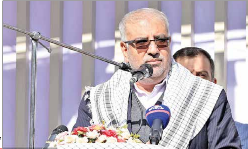
سخترانی وزیر نفت در آیین صبحگاه مشترک بسیجیان صنعت نفت

وزیر نفت اظهار کرد: دشمن در دهه‌های اخیر به‌دنبال کاهش و قطع درآمدهای ارزی و صادرات نفت و گاز کشور بوده است، اما با همت کارکنان صنعت نفت این توفیق را پیدا نکرده و نخواهد کرد. بر خودم واجب می‌دانم برای اعتمادی که مجلس و دولت به بنده کرده‌اند از کبان کشور و صنعت نفت دفاع کنم.