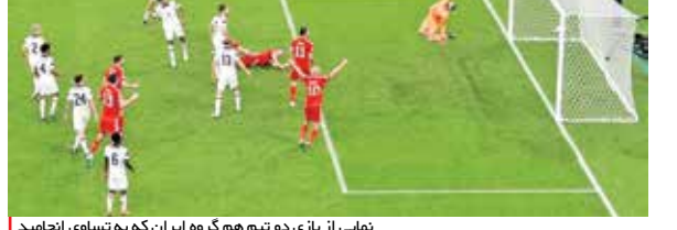
نمایی از بازی دو تیم هم‌گروه ایران که به تساوی انجامید

در ورزشگاه احمد بن علی به نظر می‌رسید شب شب آمریکایی‌ها باشد. هیجان فوق‌العاده تماشاگران آمریکایی در الریان باعث شد این تیم بازی مقابل ولز را عالی شروع کند. هوشمندی کریستین پولیشیچ و پاس او به تیموتی وه باعث شد پسر رزوه فوق‌ستاره سابق میلان و رئیس جمهور لیبریا برای آمریکا گلزنی کند. اما مشخص نیست بین دو نیمه گرگ برهالتر چه برنامه‌ای برای تیمش پیاده کرد که ورق برگشت. این ۳ امتیازی می‌توانست یانکی‌ها را با سرعت به سمت صعود ببرد، اما در نهایت امتیازها تقسیم شد تا حتی ایران هم امیدوار شود. نیمه دوم نیمه گرت و یارانش بود. بیل که برای نخستین مرتبه در جام جهانی بازی می‌کرد و ولز که بعد از ۶۴ سال به این مسابقات رسیده بود، یک امتیاز مهم گرفت. در واقع آنقدر توپ ریختند روی دروازه آمریکا که انسجام خط دفاعی یانکی‌ها را برهم بریزند. شاید با این تساوی کار برای ولز بهتر پیش برود، چرا که نبرد آمریکا با ایران قطعا تحت تأثیر حواشی می‌تواند برای این تیم دشوار شود.