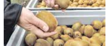
کارکنان شرکت توسعه سواحل مکران در حال رسیدگی به میوه‌های گرمسیری در گلخانه‌های سواحل مکران.