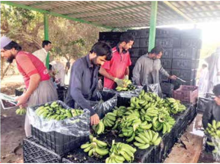
کارکنان شرکت توسعه سواحل مکران در حال رسیدگی به میوه‌های گرمسیری در گلخانه‌های سواحل مکران.