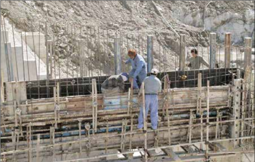
عمارتی در ایران

■ ارتقای بهره‌وری نیروی کار با فعالیت تعاونی‌های کارگری با توجه به جمعیت بیش از ۱۵ میلیون نفری جامعه کارگری به عنوان بزرگترین قشر مولد کشور و ظرفیت تعاونی‌ها به عنوان نهادهای اقتصادی حمایت‌کننده از بازار کار و تولید، ضرورت توسعه فعالیت بخش تعاون در راستای بخشی از سیاست‌های اقتصاد و اشتغال و گسترش تعاونی‌ها