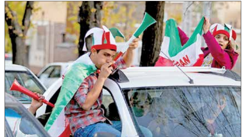
شهر کرد - ایرنا