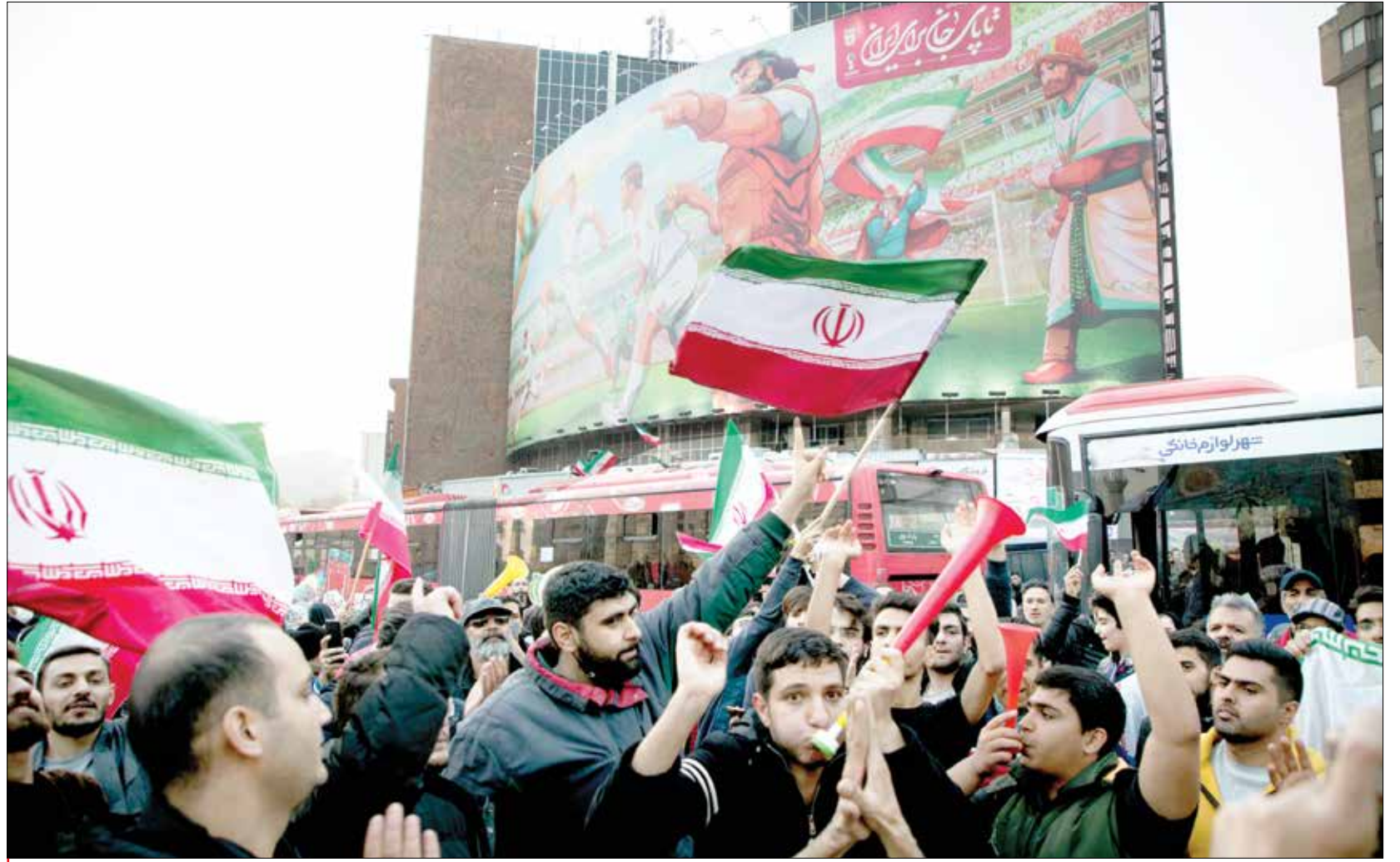
تهران - آژانس عکس ایران