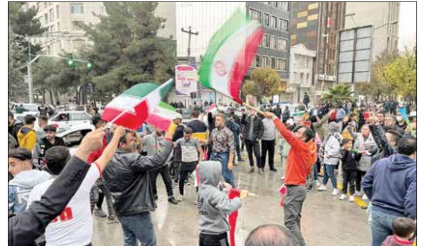
خراسان رضوی