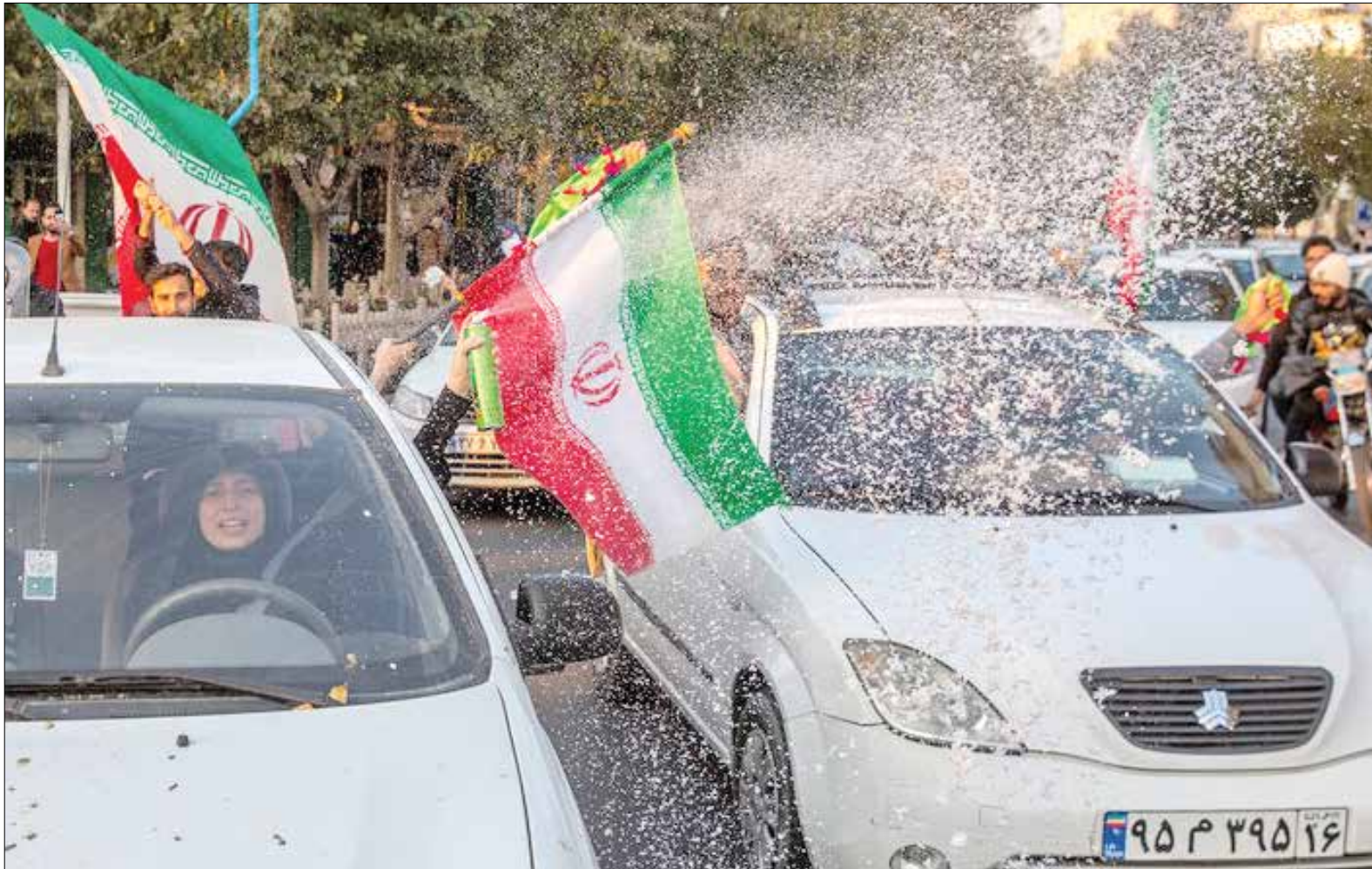
قم - ایستا

عکس‌ها همیشه حرف‌های زیادی در دل خود دارند. نشانه‌هایی از غم، شادی، خشم، هیجان، همدلی، اتحاد یا هر چیز دیگری که فکرش را بکنند. گاهی اوقات عکس‌ها، برای ثبت شدن در دل تاریخ هستند. مثل عکس‌های بی نظیری که پس از بازی برابر ولز از دریچه دوربین عکاسان حاضر در ورزشگاه احمد بن علی شهر الریان به ثبت رسید. تصاویری مربوط به خوشحالی بازیکنان تیم ملی از برد تاریخی که در جام جهانی ۲۰۲۳ قطر به دست آوردند. شادی هوادارانی که مدت‌ها بود انتظار کسب چنین بردی را می‌کشیدند و عکس‌های جالب توجه دیگری که پس از این روز خاطره‌انگیز برای میلیون‌ها ایرانی عاشق و علاقه‌مند به تیم ملی گرفته شده است. حالا می‌توان با لذت تمام، به این عکس‌ها نگاه و لحظات خاطره‌انگیز برد ارزشمند تیم ملی را در اذهان مرور کرد. این شما و این عکس‌هایی که توسط عکاسان هنرمند به ثبت رسیده است.