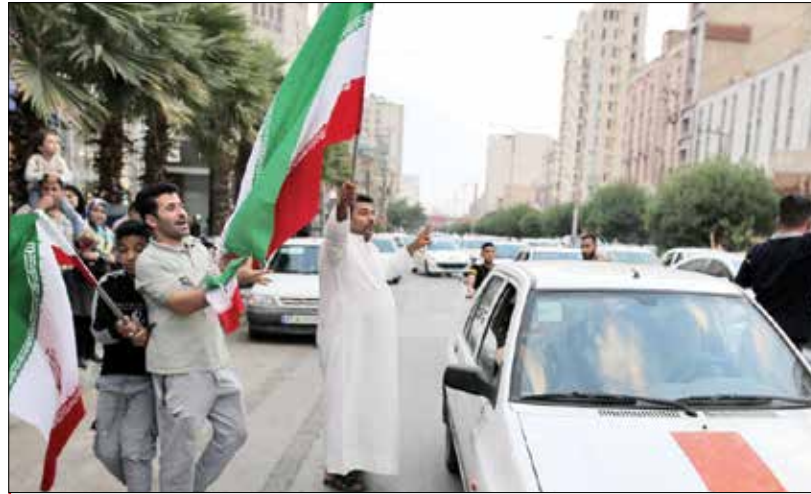
اهواز - مهر