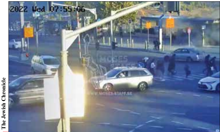
The Jewish Chronicle

اعلام هشدار کاخ سفید هفته گذشته جو بایدن، رئیس جمهور امریکا پس از تیراندازی مرگبار در کلرادو واکنش نشان داد و خواستار فوریت اجرای اپیدمی سلامت عمومی خشونت مسلحانه در همه ابعاد شد. وی با ابراز نگرانی از جرایم مسلحانه امریکا گفت: «ابتدای سال، من مهم‌ترین قانون کنترل سلاح در نزدیک به سه دهه اخیر را امضا کردم و اقدامات تاریخی دیگری را در این زمینه انجام دادم اما این اقدامات کافی نبود و باید برای تحریم سلاح و جمع‌آوری اسلحه از خیابان‌های امریکا چاره‌ای پیدا کنیم.» این هشدار واستیصال در حالی از سوی کاخ سفید به گوش می‌رسد که همچنان به رغم آمار فزاینده کشتار و خشونت‌های مسلحانه در امریکا، سیاستمداران این کشور بر سر قوانین کنترل سلاح با یکدیگر توافق ندارند. این در حالی است که مرکز پیشگیری و کنترل بیماری‌های امریکا در آخرین آمار خود در حالی که هنوز آمار امسال را اعلام نکرده است، شمار خشونت‌های مسلحانه خانگی با سلاح را با رشدی ۸،۳ درصدی در سال گذشته در مقایسه با ۲۰۲۰، بسیار نگران کننده خوانده است.