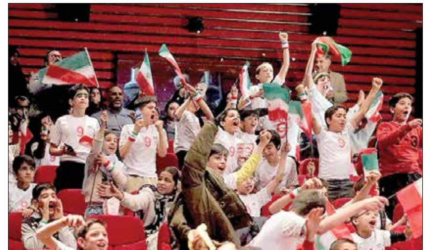
شیراز - تسنیم