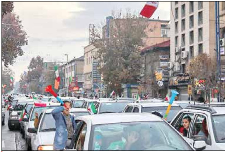
ارومیه - ایکننا