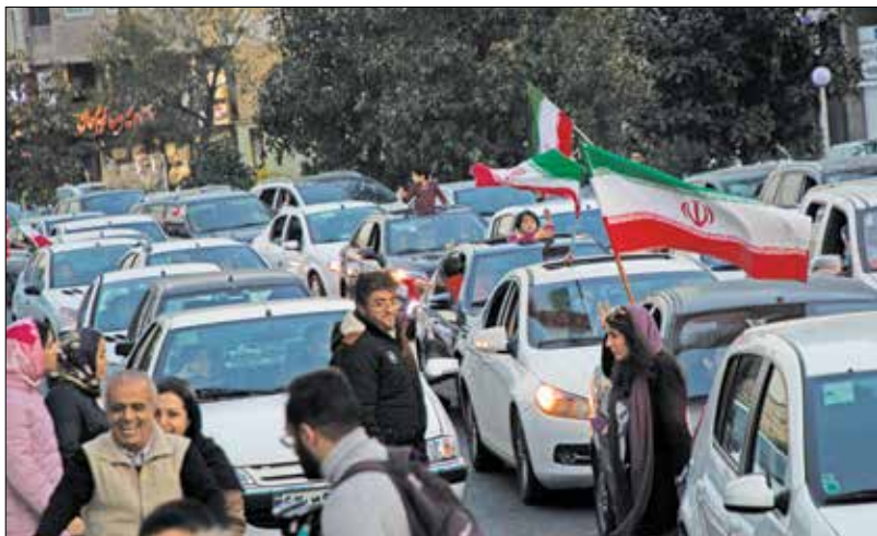
تهران - آژانس عکس ایران