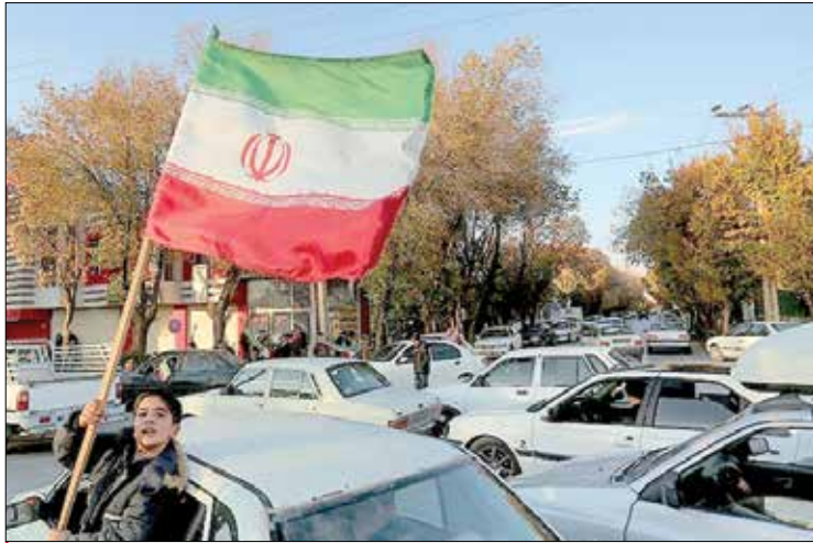
اصفهان - تسنیم