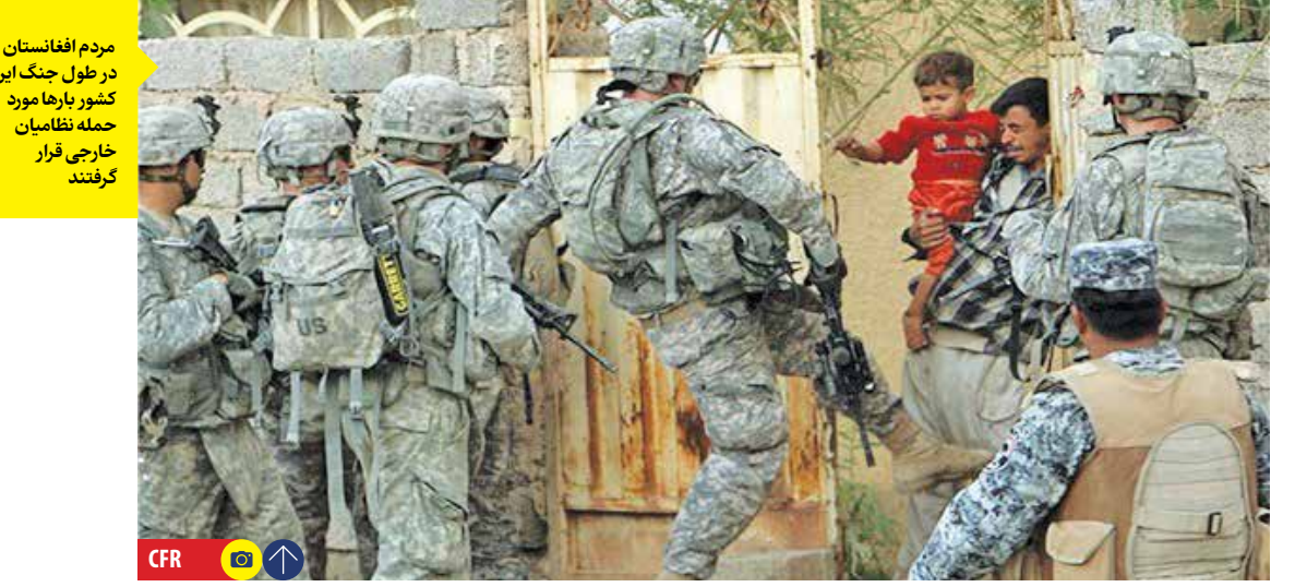
مردم افغانستان در طول جنگ این کشور بارها مورد حمله نظامیان خارجی قرار گرفتند

پرونده جنایات جنگی در افغانستان از سال ۲۰۰۶ کشته شده. در این پرونده به غیر از نیروهای داخلی در افغانستان، ارتش آمریکا و برخی کشورهای ناتو نیز متهم به ارتکاب جنایات جنگی علیه غیرنظامیان شدند. اما آمریکا بیشترین صفحات پرونده جنایات جنگی را نه تنها در افغانستان بلکه در تمام کشورهای دارد که در آنها حضور داشته است. به تازگی، سازمان دیده‌بان حقوق بشر گزارشی را منتشر کرد که نشان می‌داد در سال‌های ۲۰۱۸ و ۲۰۱۹ که حملات تهاجمی تر نیروهای آمریکایی افزایش یافته، غیرنظامیان بسیاری کشته شدند. اما لوید آستین، وزیر دفاع آمریکا در واکنش به این گزارش بیان کرد که «منی خواهد در مورد موارد گذشته تحقیق کند؛ چون این کاری اشتباه است.» بی بی سی در گزارشی نتایج بررسی‌های تیم تحقیقاتی خود را انتشار داد که نشان می‌داد نیروهای ویژه انگلیس در جریان سفرش ماه‌ها به ولایت هلمند از نوامبر ۲۰۱۰ تا مه ۲۰۱۱ دست کم ۵۴ افغانستانی را کشته‌اند. علاوه بر آن، هری پسر چارلز سوم و از اعضای خانواده سلطنتی، فاش کرد که ۲۵ شهروند افغانستانی را در جریان دو سفرش برای انجام شش ماه‌هویت به افغانستان در سال‌های ۲۰۰۸ و ۲۰۱۳ به قتل رسانده است. دولت انگلیس نیز تحقیقاتی را در مورد کشتار در