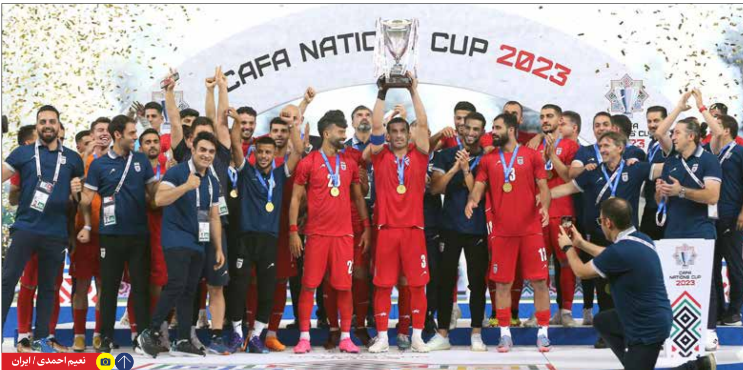
نعمت احمدی / ایران

تیم ملی فوتبال کشورمان، دیروز در فینال تورنمنت کافا برابر ازبکستان قرار گرفت. این بازی در نهایت با نتیجه ۱-۰ صفر به پایان رسید تا تیم ملی به قهرمانی تورنمنت کافا برسد