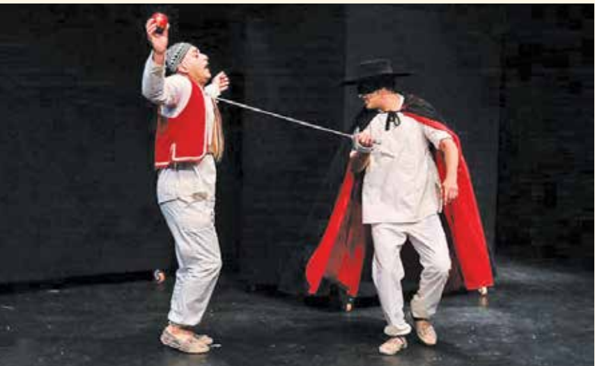
نمایی از نمایش «چهل‌گیس» به کارگردانی حسین جمالی

فرآیند اعم از -به اصطلاح- تئاتری‌ها و غیرتئاتری‌ها را با عنوان زیبایی به نام تئاتر گرد هم جمع می‌کنند تا به طرز نامحسوس، مکالمه اجتماعی شکل یافته از بینش‌ها در قالب هنر تئاتر شکل بگیرد. ارتباط‌های فرهنگی را شکل می‌دهد، خانه‌های دانشجویی، کافه‌های دانشجویی، پاتوق‌ها و خوابگاه‌های دانشجویی جایی برای تبادل افکار متعال، جایی برای تئاتر آینده است؛ و این حرف کمی نیست. به همین دلیل از دوران دانشجویی تا امروز با خودم قرار گذاشتم «تا همیشه دانشجویانم.»