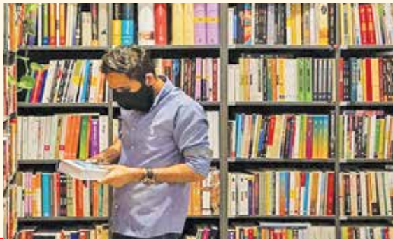
دبیر علمی جشنواره ملی کتاب دانشجویی پیرامون وضعیت آثار تألیفی دانشگاهی

علمی و دانشگاهی شده این است که این‌گام مهم درست زمانی برداشته شده که شاهد سباه‌نمایی و تلاش برخی برای ناامید ساختن جوانان و سیطره بی‌انگیزگی بر جامعه هستیم. من منکر مشکلاتی که در زمینه کتاب‌های دانشگاهی با آنها روبه‌رو هستیم؛ منتهی تأکید دارم که در کنار صحبت از کاستی نباید شور و شوق حاکم بر جامعه دانشجویی را نادیده بگیریم.» سهام قابل توجه زنان از نشر کتاب‌های دانشگاهی