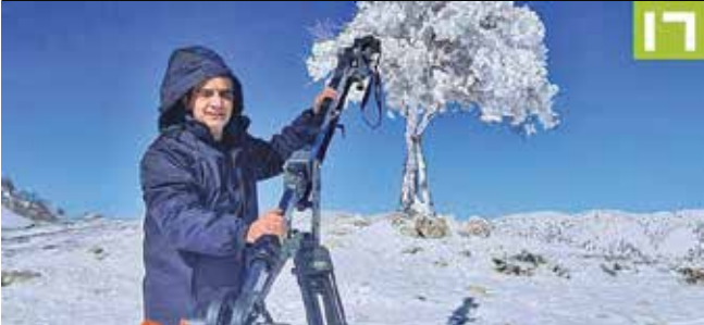
نمایی از مستند «اپوش»

چه گذشته که بسیاری از آنها مهاجر هستند؟ این مستندساز درباره موضوع این فیلم مستند توضیح داده است: «این فیلم درباره مردم سرزمین افغانستان است.» مستند با این سؤال آغاز می‌شود که: «بیش از ۴ دهه است که مهاجران افغانستانی را در ایران می‌بینیم. بر این مردم چه گذشته که امروز بسیاری از آنها مهاجر هستند؟» جلسه مشترک مستندسازان و نمایندگان پروژه‌های بزرگ طبق مصوبه هیأت دولت، دستگاه‌های اجرایی ملزم به مستندنگاری و ثبت تصویری طرح‌ها و پروژه‌های مهم کشور شده‌اند. به‌منظور پیگیری این طرح و فراهم شدن شرایط تعامل و همکاری بین وزارتخانه‌ها