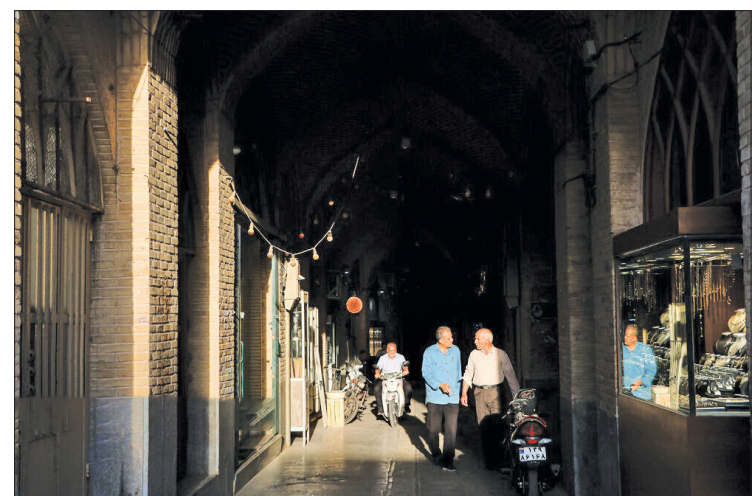
▲ اصفهان شهر بازارچه‌ها