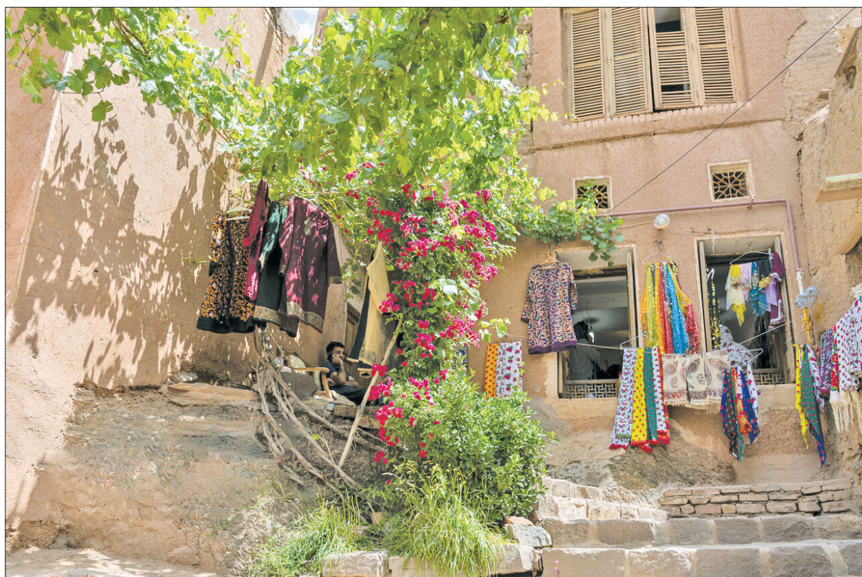
▲ ایبانه نگینی سرخ در دل کویر