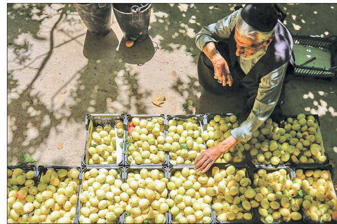
▲ میوه‌های تابستانی در باغات گلدشت اصفهان