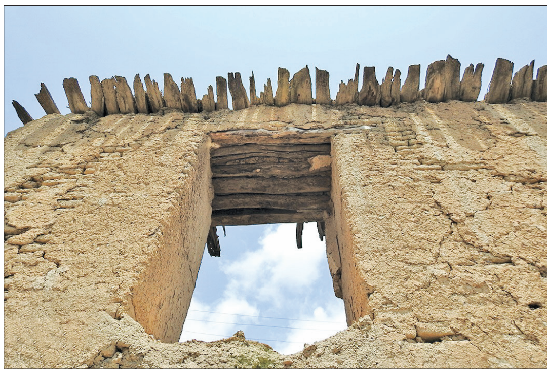
▲ به جا مانده از زلزله سال ۱۳۶۹ رودبار