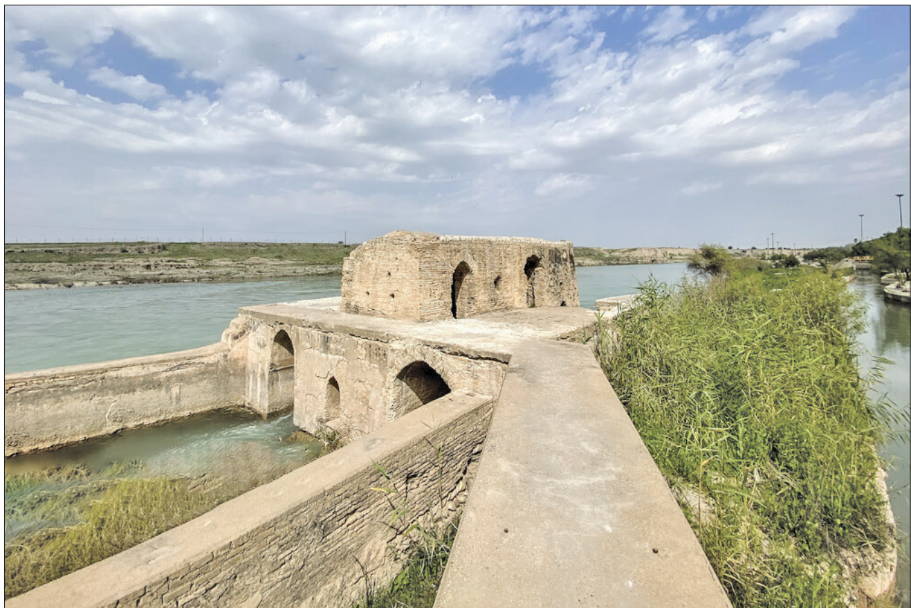
▲ آسیاب‌های آبی دزفول؛ قرن‌ها گردش آب و سنگ