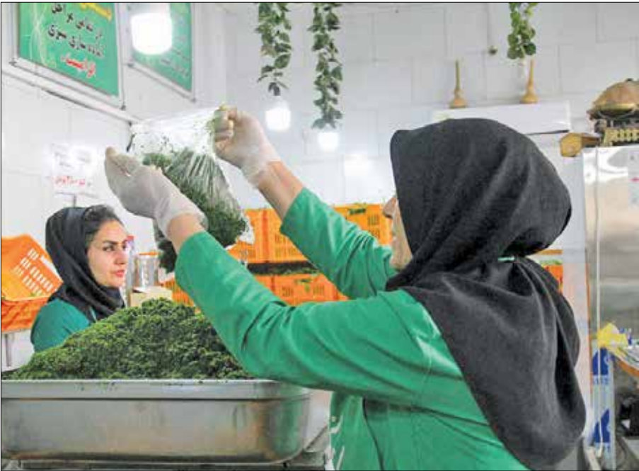
آرتیا همتیان، رئیس ستاد ساماندهی و حمایت از مشاغل خانگی وزارت تعاون، کار و رفاه اجتماعی، در جریان بازدید از یک مرکز اشتغالزایی در تهران.

همتیان با بیان اینکه اشتغالزایی امری چند بعدی است که بسیاری از تسهیلات مشاغل خانگی برگزار شده یک ماه به این بانک‌ها فرصت داده شده که زمینه پرداخت این تسهیلات را فراهم کنند. به گفته همتیان، بانک‌های توسعه تعاون و رفاه با بالای ۴۰ درصد بیشترین میزان تسهیلات مشاغل خانگی را پرداخت کرده‌اند و بانک‌های پست بانک و کشاورزی نیز کمتر از ۱۰