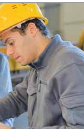
مدیرکل بهداشت، بیمه‌های اجتماعی و درمان کمیته امداد:

برابری دستورالعمل ابلاغی، رسیدگی به اختلافات کارگری و کارفرمایی موضوع ماده ۱۵۷ قانون کار قبل از طرح دعوا در مراجع حل اختلاف کار در تشکل کارگری مستقر در کارگاه انجام می‌گیرد و در صورت عدم حصول سازش، موضوع در مراجع حل اختلاف کار مطرح و