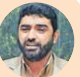
سخنگوی کمیسیون فرهنگی؛

عضو شورای عالی انقلاب فرهنگی با تأکید بر اینکه وزارت فرهنگ و ارشاد اسلامی به وظایف خود ذیل مصوبه عفاف و حجاب بخوبی عمل کرده است، گفت: این وزارتخانه را در زمینه مسائلی که در حوزه حجاب ایجاد شده است، مقصر نمی‌دانیم. وزارتخانه کارش را بخوبی انجام داده است و نمره خوبی به آن می‌دهیم. اینکه چرا وضعیت حجاب این‌گونه است، بحث جدایی است. وزارت فرهنگ و ارشاد اسلامی با انگیزه و علاقه در این زمینه تلاش می‌کند. نسبت به مقوله حجاب توجه و دغدغه جدی دارد. هرجا لازم بوده دستورالعمل بدهد، دستورالعمل‌ها