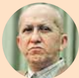
نایب‌رئیس کمیسیون فرهنگی مجلس؛