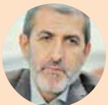
عضو کمیسیون فرهنگی مجلس؛

نمایشگاه کتاب به صورت مجازی است. از سوی دیگر نقش وزارت ارشاد در حکمرانی فرهنگی امری انکارناپذیر است و دلیل آن حضور و همکاری این نهاد فرهنگی با طیف وسیعی از هنرمندان و اهالی فرهنگ با دیدگاه‌های متنوع است. در این گزارش نمایندگان مجلس، هنرمندان و نویسندگان عملکرد وزارت فرهنگ و ارشاد اسلامی را ارزیابی کردند.