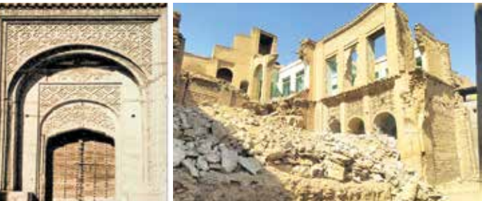
دزفول، ۱۳۴۸ / ایران

دزفول قدم می‌زند، تنگی کوچه‌ها و مصالحی که به کار برده شده و نیز استفاده از نور و سایه را می‌بینید. آدم‌هایی که از آن کوچه می‌گذرند، محیط برای در امان بودن گرمای سخت را مشاهده می‌کنند. ترتین دیوارها در معماری دزفول در بخش «خوون» یا پیشانی بنا در نظر گرفته شده علاوه‌بر ترکیب پس و پیش آجرها در سطح دیوار قائم و ایجاد سایه در بخش‌هایی از روز ترکیبات زیبایی از هنر آجرکاری را به نمایش گذاشتند و همین طرح‌های زیبا می‌تواند منبع لایزالی از اشکالی باشد که هنرمندان آجرکاری یا آجرتراش یا خوون چین به آن مشغول بودند. علاوه‌بر فضاهای درونی و اندرونی وجود درخت حوضی در میان فضای حیاط خانه‌ها بخش دیگری از معماری بودند که فضا را لطیف می‌کردند. آثار تاریخی به‌جای مانده از دوره‌های ساسانی (پل قدیم دزفول) و منازل و ابنیه تاریخی به‌جای مانده از دوره‌های تیموری و صفویان متأسفانه مورد هجوم و تخریب سازمان یافته به اسم نوسازی و بازسازی قرار گرفتند. قابل توجه است که اغلب خانه‌های تخریب شده دارای باستان‌شناسی و ثبت ملی بوده‌اند. شاید بالغ بر ۲۰۰ هکتار از بافت قدیمی دزفول وجود داشته که خیابان کُشی‌ها و دسترسی‌های جدید و تعرضات جدید به وسیله ارگان‌های خدتمانی از بین رفته‌اند. از سازمان‌های فعال در این امر می‌توان شهرداری (ساخت پاساژ و اماکن خرید) و اداره اوقاف (طرح توسعه حرم سزبقا) نام برد. اگر از تخریب نام ببریم متأسفانه در این چهل سال