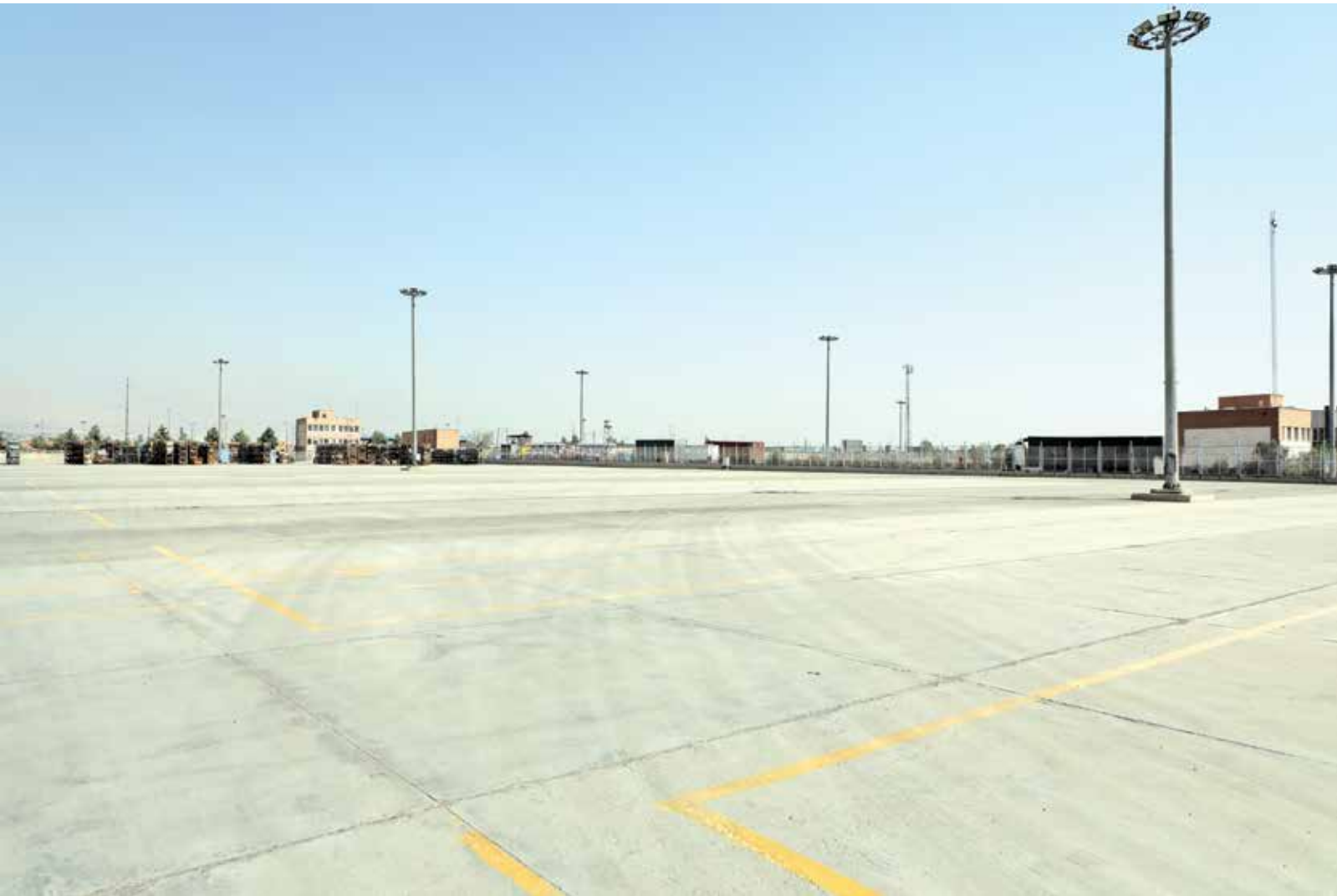
پارکینگ فضای ایران خودرو / مهرماه ۱۴۰۱ / عظیمرضا موسیائیکر / ایران