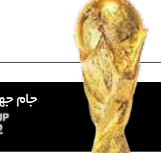
جام جهانی قطر ۲۰۲۲ FIFA WORLD CUP Qatar 2022

■ حذف غم‌انگیز هرچه زمان بیشتر به پایان بازی قطر و سنگال نزدیک می‌شد هواداران