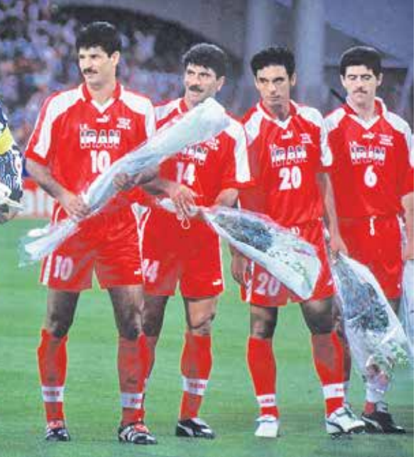
نمایا از مراسم آغاز بازی ایران و آمریکا در جام جهانی ۱۹۹۸ فرانسه که با برتری ۲- ۱ تیم ملی کشورمان به پایان رسید

کردند که آن مسابقه ۱-۱ مساوی شد؛ مسابقه‌ای که در آن، مهدوی‌کیا در دقیقه ۶ برای تیم ملی گل زد و پس از آن آمریکا با گل دقیقه ۴۸ آراماس بازی را به تساوی کشاند. حالا قرص است ایران با آمریکایی بازی کند که نسبت به ۲۲ سال گذشته تفاوت زیادی کرده و توانسته سطح خود را بالاتر ببرد. آمریکا برای یازدهمین بار است که حضور در جام جهانی را تجربه می‌کند. بهترین مقامی که یانگی‌ها در این مسابقات کسب کرده‌اند، سومی اولین دوره جام جهانی در سال ۱۹۳۰ بوده است. آمریکا برای یازدهمین بار است که حضور در جام جهانی را تجربه می‌کند. بهترین مقامی که یانگی‌ها در این مسابقات کسب کرده‌اند، سومی اولین دوره جام جهانی در سال ۱۹۳۰ بوده است. آمریکا برای یازدهمین بار است که حضور در جام جهانی را تجربه می‌کند. بهترین مقامی که یانگی‌ها در این مسابقات کسب کرده‌اند، سومی اولین دوره جام جهانی در سال ۱۹۳۰ بوده است. آمریکا برای یازدهمین بار است که حضور در جام جهانی را تجربه می‌کند. بهترین مقامی که یانگی‌ها در این مسابقات کسب کرده‌اند، سومی اولین دوره جام جهانی در سال ۱۹۳۰ بوده است. آمریکا برای یازدهمین بار است که حضور در جام جهانی را تجربه می‌کند. بهترین مقامی که یانگی‌ها در این مسابقات کسب کرده‌اند، سومی اولین دوره جام جهانی در سال ۱۹۳۰ بوده است.