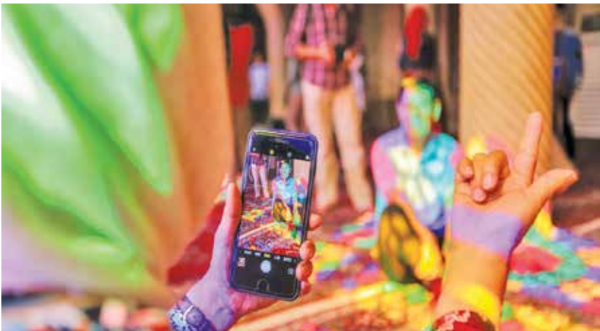
مسجد نصیرالملک شیراز که گردشگران خارجی علاقه ویژه‌ای به معماری اش دارند

انتخاب شده است. سازمان جهانی گردشگری، برنامه‌ریزی و توسعه به وضعیت روبه بهبود این صنعت در جهان، روز جهانی گردشگری در سال ۲۰۲۲ میلادی را فرصتی برای تفکری دوباره برای گردشگری بازان‌دیشی برای گردشگری عنوان کرده است. هدف UNWTO از انتخاب این شعار، الهام‌بخشیدن و کمک به توسعه این بخش از طریق راه‌هایی همچون آموزش و اشتغال و تأثیر گردشگری بر کره زمین و فرصت‌ها رشد پایدار است.