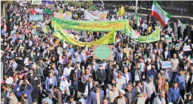
بیرجند / ایرنا