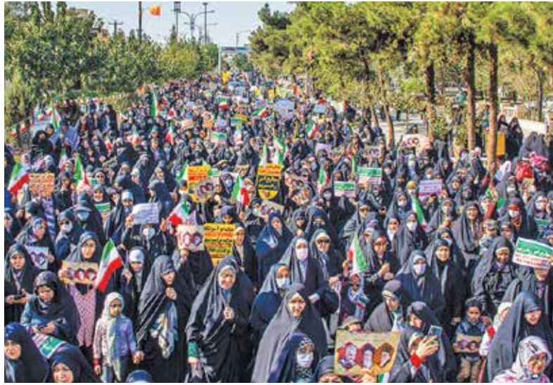
سمنان / ایرنا