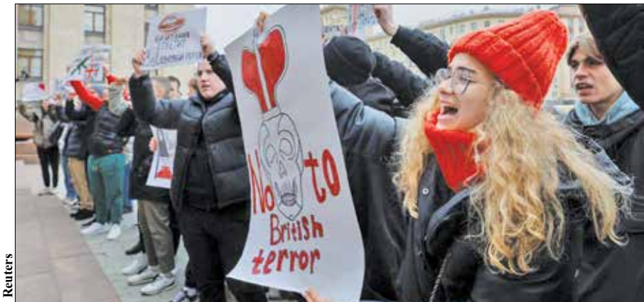
همزمان با حضور سفیر انگلیس در وزارت خارجه روسیه، معترضان به مداخله‌جویی‌های لندن، مقابل این نهاد تجمع کردند

■ اسنادی که بزودی علنی خواهد شد ساعاتی پس از احضار سفیر انگلیس به وزارت خارجه روسیه، آندری کلین، همتای روس او در لندن در مصاحبه‌ای با شبکه اسکای نیوز با محکوم کردن مداخلات لندن در بحران اوکراین، مداوم این شرایط را بسیار خطرناک توصیف کرد. به نوشته راشاتودی، کلین در این مصاحبه با تأکید بر اینکه انگلیس در مسائل اوکراین زیاد عمیق شده است، گفت: «مسکو اطلاعاتی در اختیار دارد که نقش کارشناس انگلیسی در آموزش، آماده‌سازی و اجرای نقشه‌ها علیه زیرساخت‌های روسیه و همچنین ناوگان مسکو در دریای سیاه را روشن می‌کند. جزئیات اطلاعات درباره این حملات به بریتانیا ابلاغ شده است و در آینده‌ای