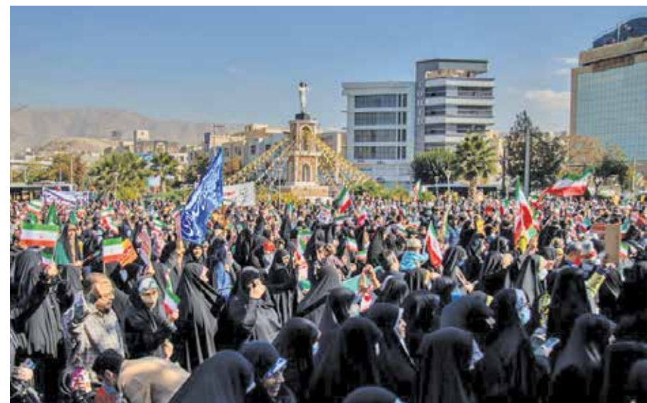
بیرجند / ایستنا