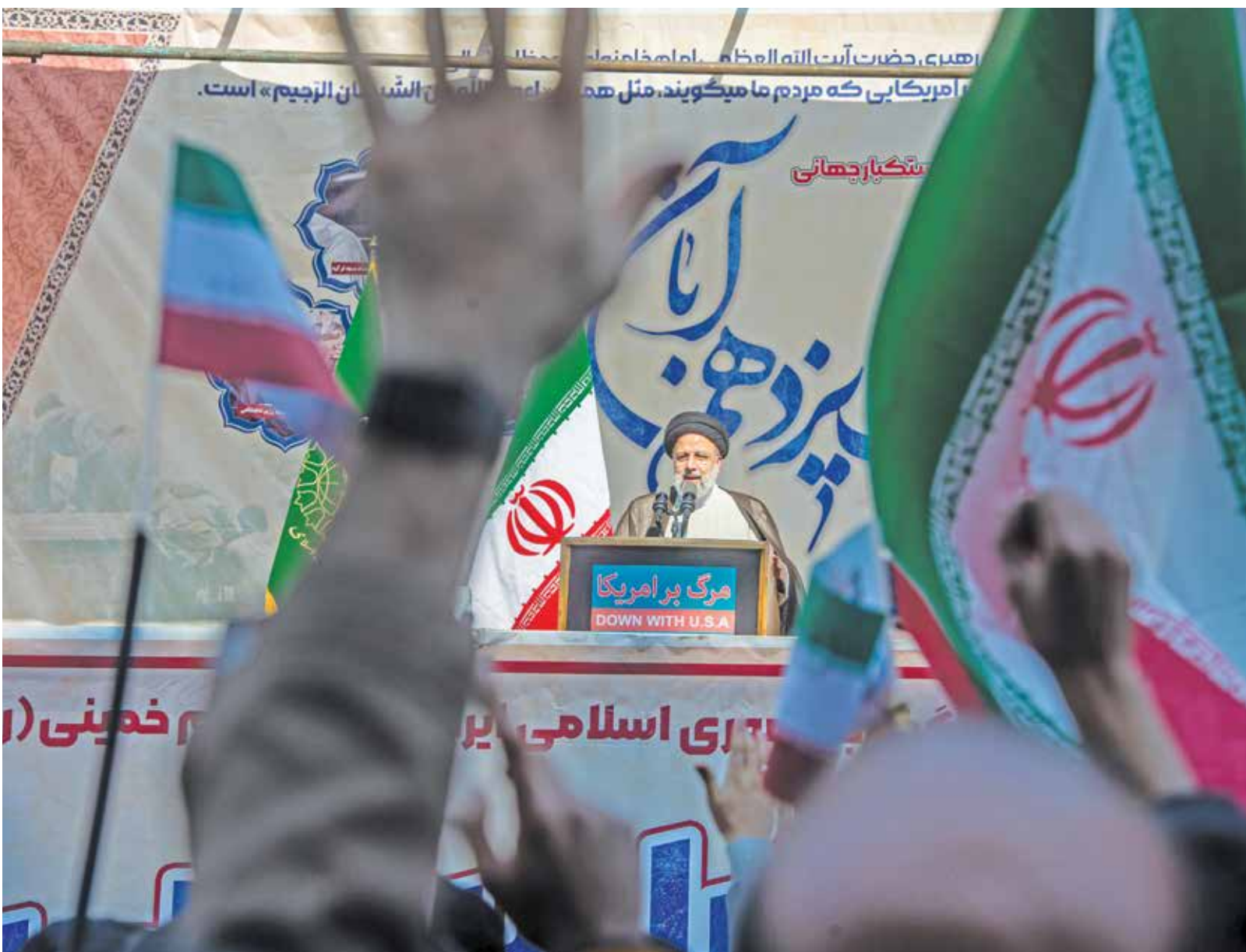
سخنرانی رئیس‌جمهور در راهپیمایی مردم تهران به مناسبت سالروز ۱۳ آبان در مقابل لانه جاسوسی / علی محمدی ایران