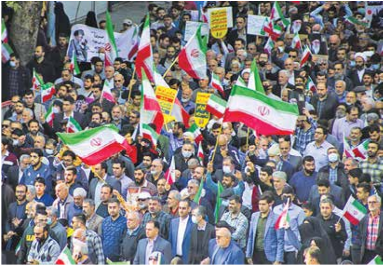
ساری / خبرگزاری صدا و سیما