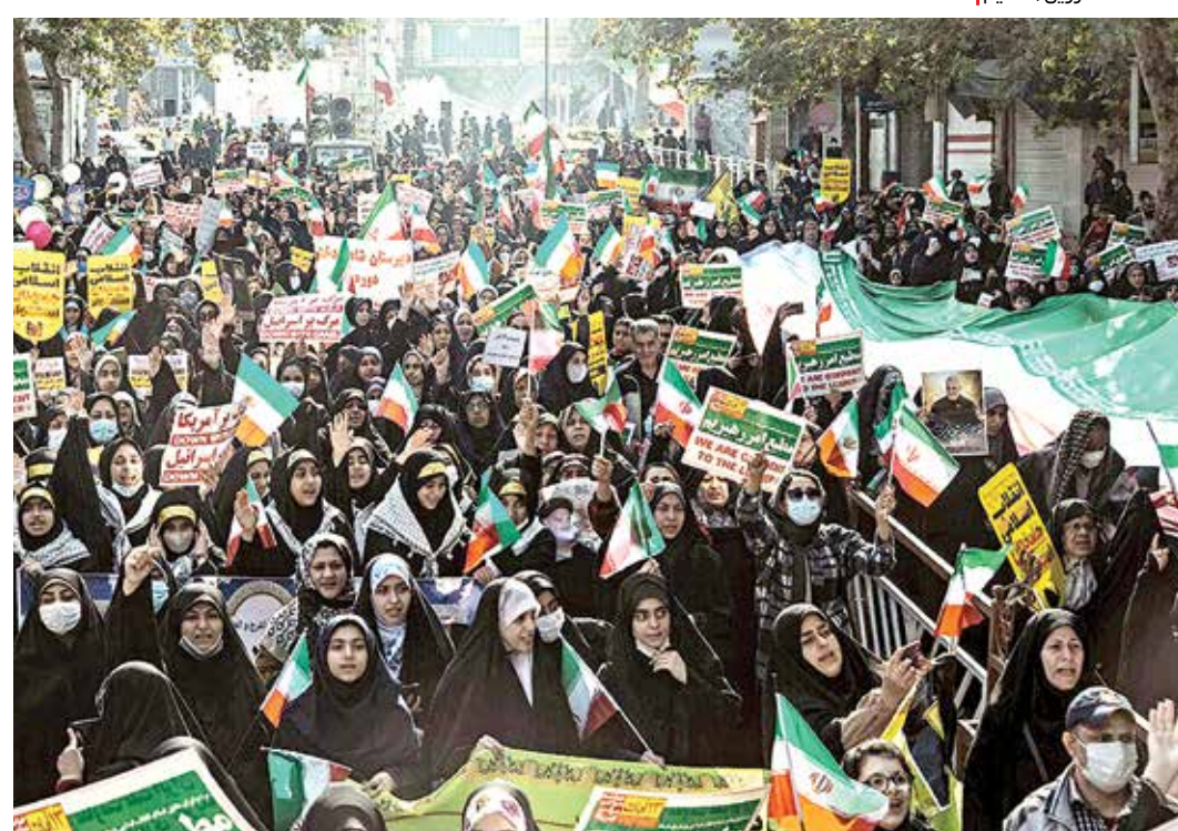
کرمان / ایرنا