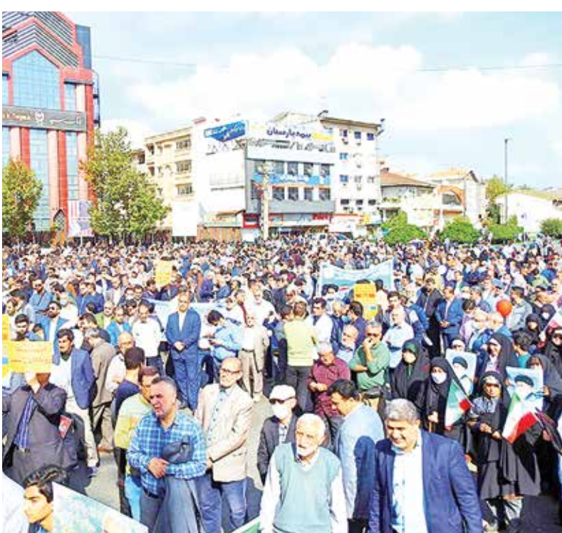
ساری / فارس