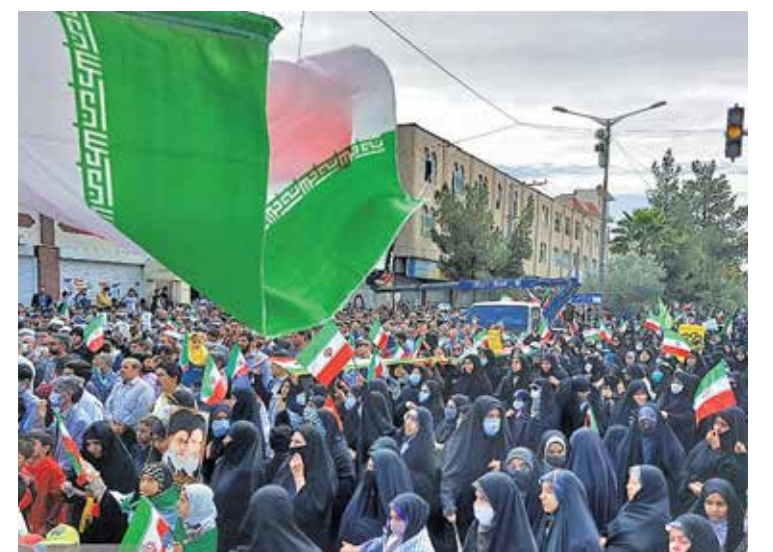
زاهدان / فارس