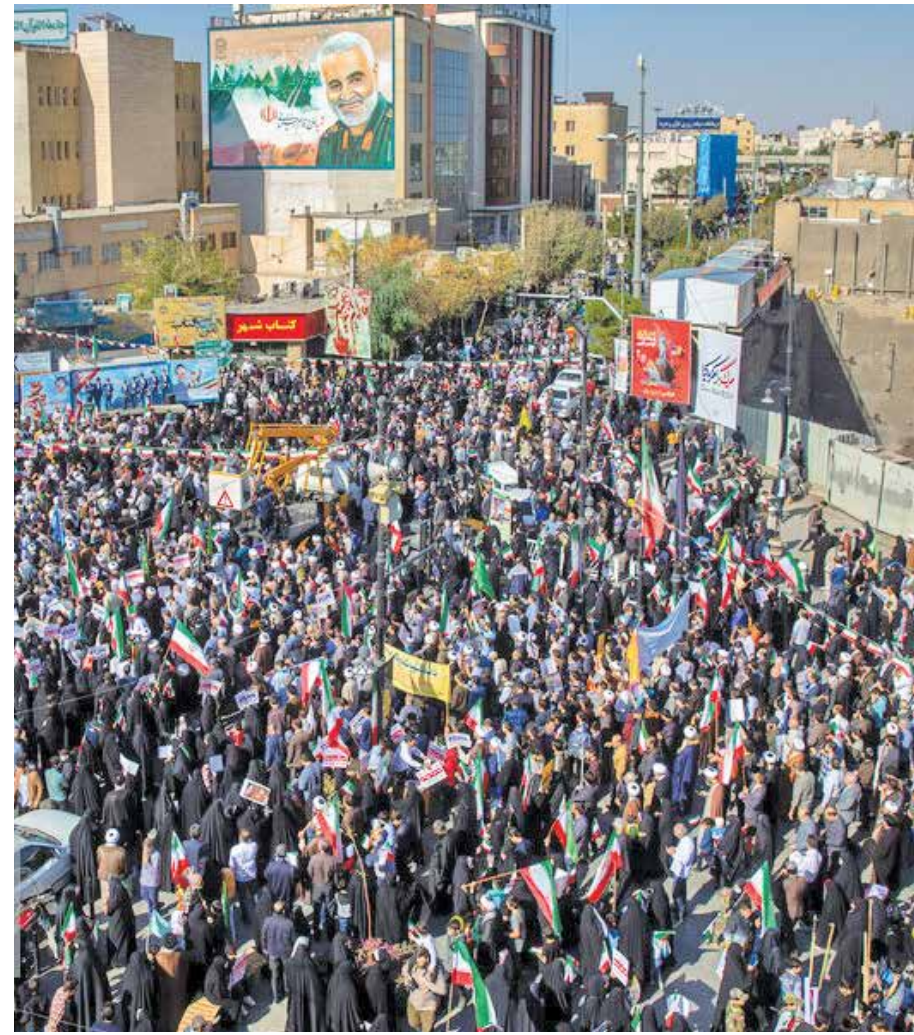
قزوین / ایستنا