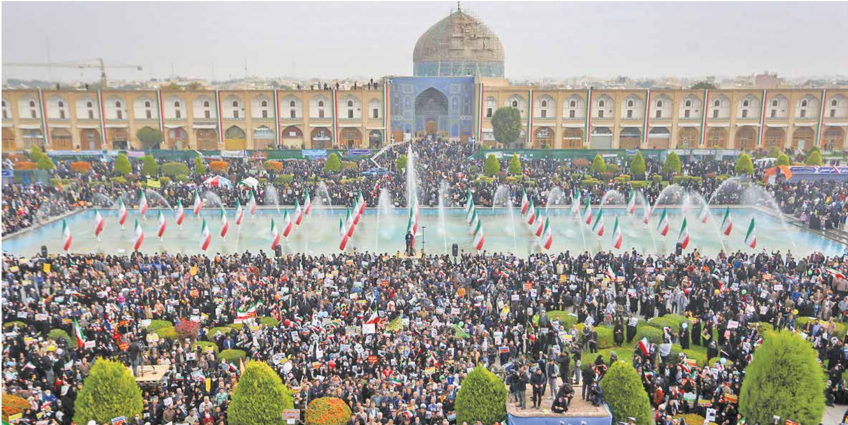
اسفهان / ایستا

۱۳ آبان امسال در ۹۰۰ شهر و مرکز استان ایران، رنگ، صدا و حال و هوایی متفاوت داشت. مردم شهرهای مختلف از دانشجو گرفته تا کارگر، کارمند و... این بار پیام ایستادگی، مقاومت و استکبارستیزی را رساتر و پرطنین تر از گذشته فریاد زدند. مردمی که حدود ۵۰ روز است شاهد فتنه انگیزی، آشوب، اغتشاش و رخدادهای تروریستی در نقاط مختلف کشور هستند که با برنامه ریزی‌ها و حمایت‌های مالی و رسانه‌ای آمریکا و متحدانش در قالب جنگ ترکیبی برپا شده است. صبرشان به سر آمده و با حضور پررنگ تر در راهپیمایی ۱۳ آبان شکست تازه ترین فتنه آمریکایی - صهیونیستی را رقم زدند. در ۱۳ آبان امسال اقوام مختلف ایران در شرق و غرب و شمال و جنوب کشور با حضور در خیابان‌ها ایران قوی، هوشیار، بیدار و بصیر را در برابر توطئه‌ها و دسیسه‌های تجزیه طلبان و پشتیبانان آمریکایی - صهیونیستی آنان مجسم کردند. تصاویری که امروز در قاب «ایران» منتشر شده تنها روایت بخشی از حماسه دیروز است که برای همیشه در تاریخ پرفراز و نشیب انقلاب اسلامی ایران ماندگار شد.