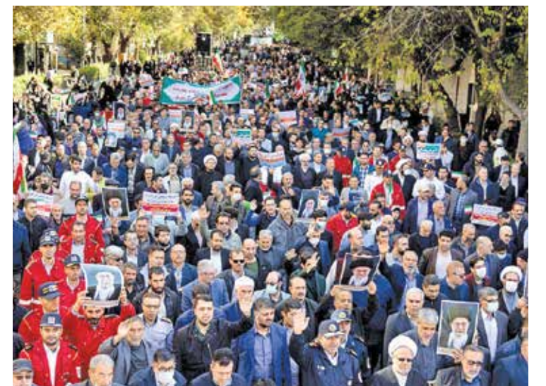
تبریز / ایرنا