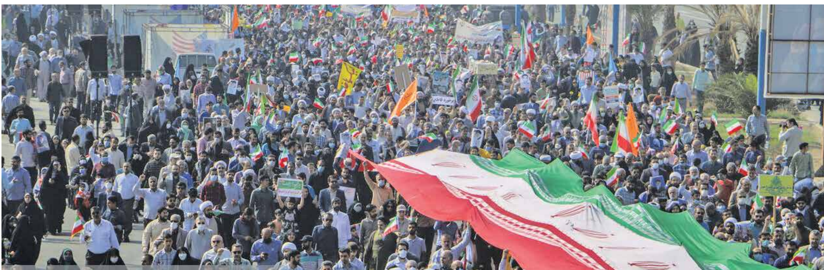
ماهاباد / مهر