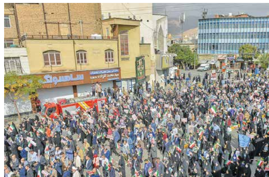
شیراز / خبرگزاری دانشجو