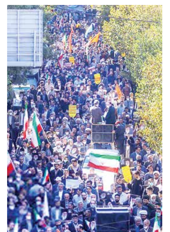
اهواز / ایستا