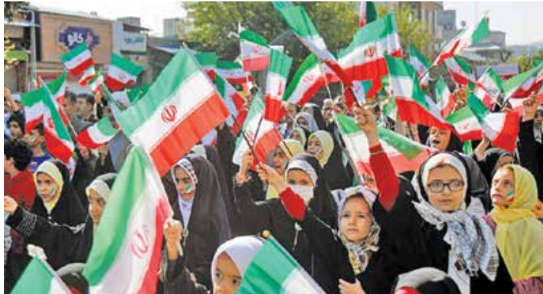
سندج / ایرنا