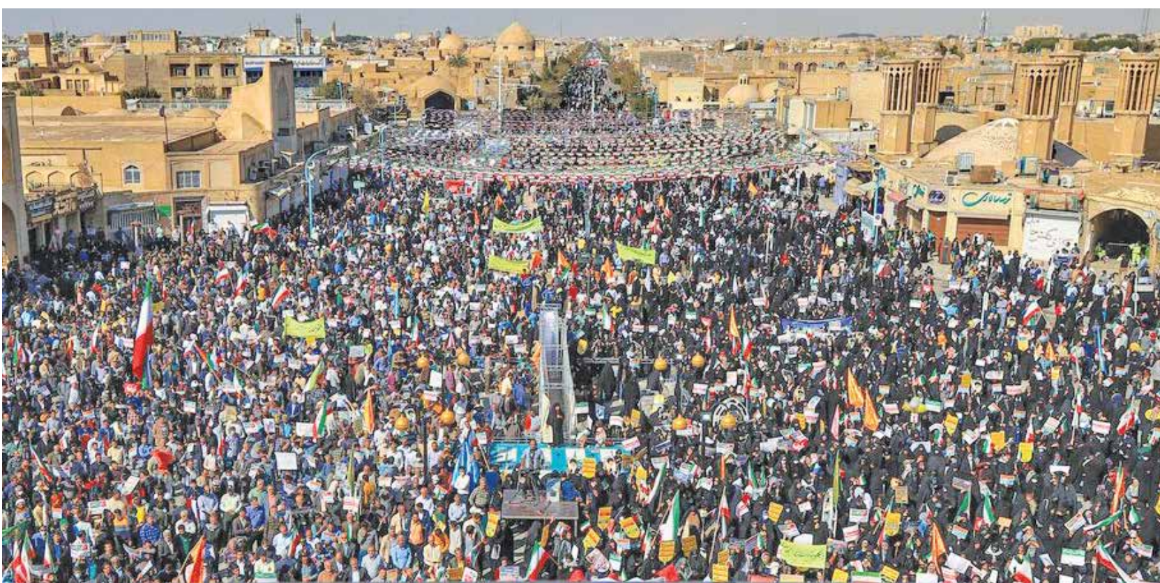
یزد / مهر