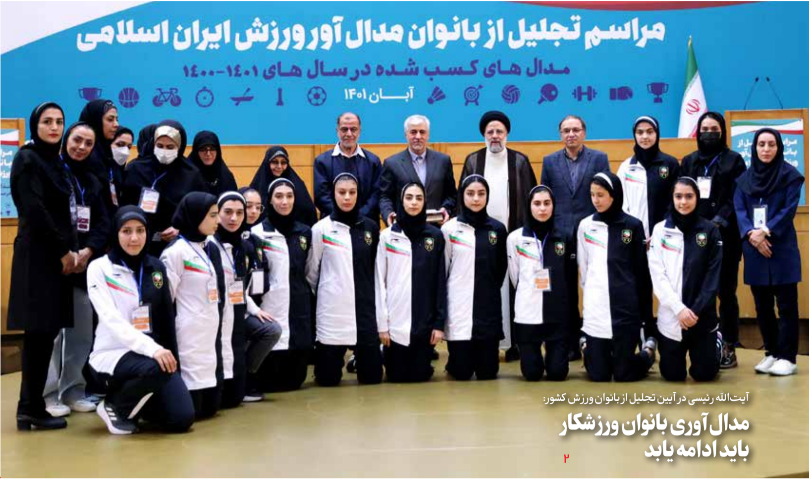
آیت‌الله رئیسی در آیین تجلیل از بانوان ورزش کشور: