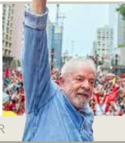
تکمیل حلقه رهبران ضد استعماری در امریکای لاتین