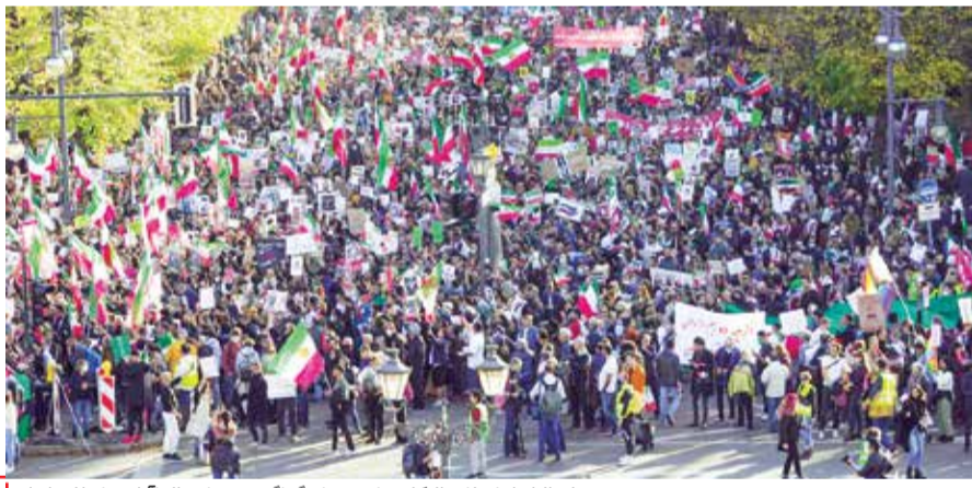
تجمع برخی از ایرانیان خارج از کشور با پرچم‌های گوناگون در حمایت از تأثرنامه‌های اخیر ایران