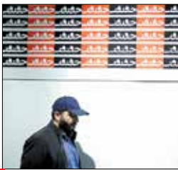
در طلاییه جشنواره سینما حقیقت

فرهنگی/ دومین روز جشنواره سینما حقیقت با پیام رئیس سازمان سینمایی آغاز شد. محمد خزاعی سینمای مستند را پیش‌تاز در جنگ روایت‌ها دانست: «سینمای ایران در گونه بی بدیل مستند با وصف آنچه گفته شد باید بیش از هر زمان دیگری در جهاد تبیین و ثبت حقیقت و نمایش آن به جامعه و نسل جوان