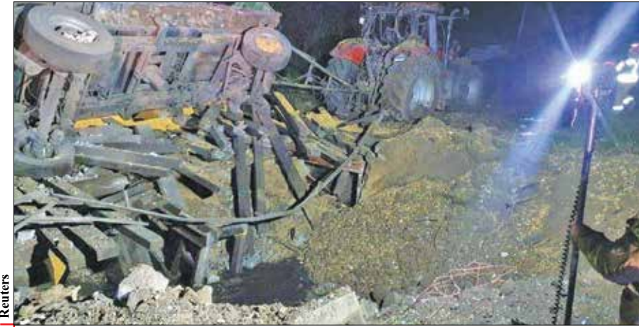
محل اصابت موشک در شرق لهستان

زهرا صفاری/ همزمان با اصابت موشک به لهستان و کشته شدن دو شهروند این کشور در نزدیکی مرزهای اوکراین، گرچه کشورهای زیرمجموعه ناتو ابتدا به سیاق سابق به سمت اتهام‌زنی به روسیه پیش رفتند اما ساعاتی بعد از امریکا گرفته تا لهستان و آلمان و دیگر کشورهای عضو پیمان آتلانتیک شمالی با این ادعا که موشک‌های اصابت شده به احتمال زیاد از سیستم پدافندی کی‌یف بوده است، موضع خود را تا حدودی تغییر داده و با تشکیل نشست فوری از صف‌آرایی برابر مسکو اجتناب کردند. به گزارش شبکه سی ان بی‌سی نیوز، این حمله موشکی در حالی روز سه‌شنبه خواب آرام غربی‌ها را نارام کرد که پایدن و دیگر رهبران جهانی در نشست گروه ۲۰ در بالی کرده‌مم آمده بودند و ولودیمیر زلنسکی در سخنرانی‌اش خطاب به شرکای غربی، ۱۰ درخواست را برای کمک مطرح کرد. اما در این اوضاع انتشار خبری درباره اصابت موشک به انتار گندم در روستایی در شرق لهستان، فضای نشست را به کلی تغییر داد. به گزارش تاس، به رغم آنکه سیاستمدارانی مانند ریسی سوناک، نخست‌وزیر انگلیس بافاصله پس از این حادثه، روسیه را به باد انتقاد گرفتند اما ساعاتی بعد جو پایدن و دیگر شرکای او در ناتو این حمله