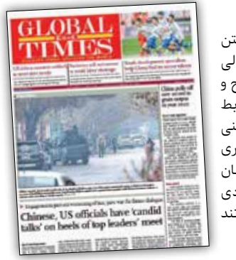
کولبال تایمز چین

با وجود آشوب‌هایی که در این مدت حامیان بولسونارو به راه انداخته‌اند، روال‌های قانونی برای آغاز ریاست جمهوری لولا داسیلوا در حال انجام است و خود او و معاونش به طور رسمی به عنوان برنده انتخابات تأیید شده‌اند و بنا بر روند همیشگی، مراسم تحلیف رئیس جمهور جدید در روز اول ژانویه ۲۰۲۳ (۱۱ دی) برگزار خواهد شد.