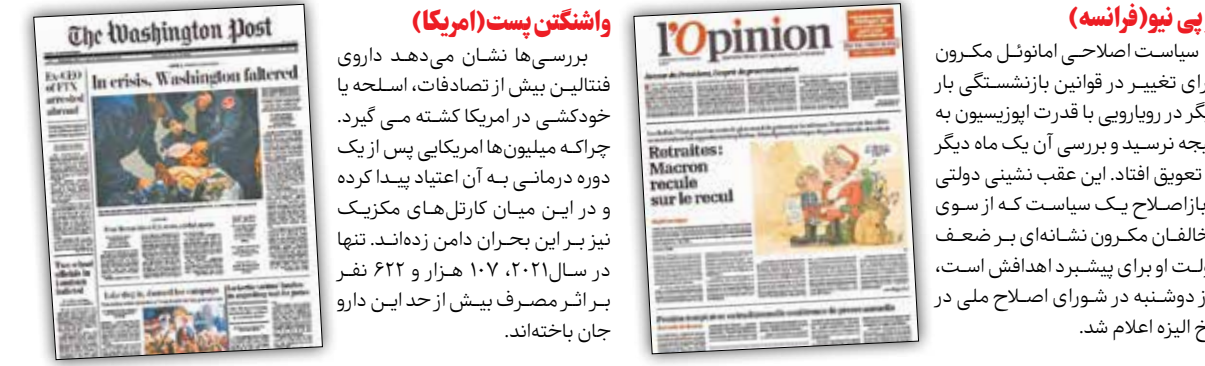
واشنگتن پست (امریکا)

سیاست اصلاحی امانوئل مکرور برای تغییر در قوانین بازنشستگی بار دیگر در رویارویی با قدرت یوزیسیون به نتیجه نرسید و بررسی آن یک ماه دیگر به تعویق افتاد. این عقب‌نشینی دولتی از بازاصلاح یک سیاست که از سوی مخالفان مکرور نشان‌های برضعف دولت او برای پیشبرد اهدافش است، روز دوشنبه در شورای اصلاح ملی در کاخ الیزه اعلام شد.