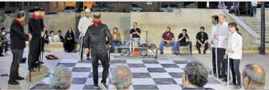
«شطرنج» به کارگردانی محمدرضا جعفری لفسوت

پدر و مادرش را گم می‌کند و اکنون که سال‌ها از جنگ می‌گذرد تصمیم به تفحص آنها گرفته است و متأسفانه با جنازه‌های خانواده‌اش روبه‌رو می‌شود و روایت این‌ها موازی پیش می‌رود. بعد از اینکه طرح نمایش را به دبیرخانه جشنواره ارسال کردیم و در مرحله بازخوانی پذیرفته شد گروه شروع به تمرین کرد و تقریباً در ۱۲ جلسه تمرین کار آماده و بسته شد و فیلم نمایش «پرسه در نیاز» در یک فضای خصوصی برای تمرین همان دختر تک‌پراندازی برای گروه خوب و راضی‌کننده بود. گروه ما از بچه‌های نمایش «پاپیون» ساری هستند که پنج هسته مرکزی و تعداد زیادی بازیگر دارد لذا سه بازیگر نمایش «پرسه در نیاز» از بازیگران همان مجموعه هستند و تجربه جدی اول بازیگریشان را خواهند داشت.