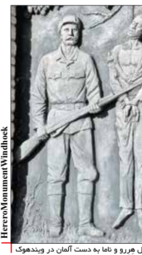
یادبود قربانیان نسل کشی قبایل هرورو و ناما به دست آلمان در ویندهوک

پیشتاز جمهوری خواهان را نشان می‌دهد اما ترامپ و پسر ارشدش به عنوان گردانندگان این شبکه همچنان به داغ کردن تئوری‌های توطئه علیه دموکرات‌ها، بر این آتش هیزم می‌ریزند.