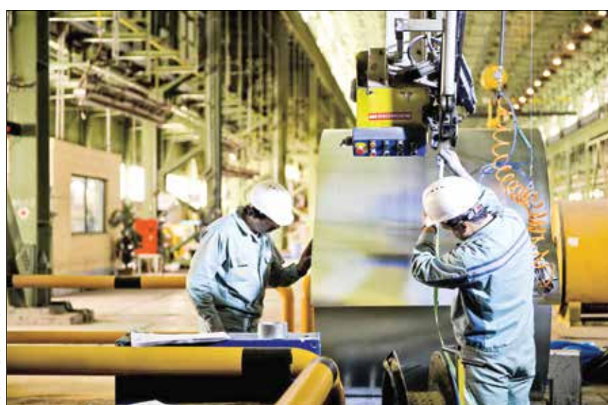
مطهریان / ایران

شاید یکی از دلایلی که باعث افزایش اشتغال در بخش صنعت در شش ماهه اول امسال نسبت به مدت