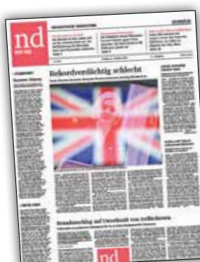
گزارش نوداچند از دیدار رهبران آمریکا و انگلیس.

به دنبال آتش سوزی در محل اقامت پناهندگان در شمال شرقی آلمان، پلیس امنیت دولتی در حال بررسی مدارک موجود است. این در حالی است که با توجه به شواهدی که کارشناسان از حرکت‌های افراطی در این کشور در دست دارند، احتمال داده می‌شود، راست‌های افراطی که مخالف حضور مهاجران در کشور خود هستند، عامل این آتش سوزی بوده‌اند.