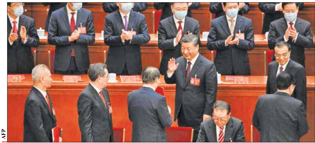
شی جین پینگ و جو بایدن در جریان دیدار رسمی در پکن.

اینکه در آستانه بازنشستگی است، به کار خود ادامه خواهد داد. انتظار می‌رود، امروز به طور رسمی اسامی مشاوران ارشد سیاسی شی جین پینگ اعلام شود. افزایش قدرت «شی» همان‌طور که ویکتور شی، کارشناس سیاسی نخبگان چین در دانشگاه کالیفرنیا به شبکه خبری سی‌ان‌ان گفته است، با این تغییرات، انتظار می‌رود، قدرت شی جین پینگ افزایش یابد. هرچند که او همین الان هم قدرتی قابل توجه دارد. او در ۱۰ سالگی که رهبری حزب کمونیست چین و ریاست جمهوری این کشور را در دست داشته است، با اقداماتی که انجام داده، توجه بسیاری از چینی‌ها را به خود جلب کرده است. او ارتش