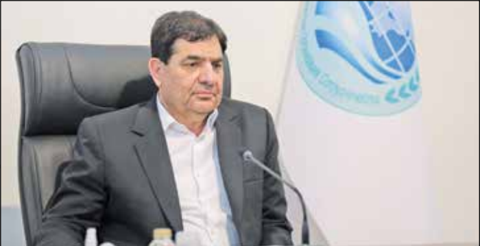
مخبر در بیست و یکمین نشست نخست وزیران کشورهای عضو پیمان شانگهای

مخبر با اشاره به اینکه ماه گذشته تهران میزبان وزیران حمل‌ونقل کشورهای محصور در خشکی آسیای مرکزی شامل چهار عضو سازمان همکاری شانگهای، نیز ایجاد شود و حوزه‌های سوخت‌های فسیلی، برق و انرژی‌های تجدیدپذیر را پوشش دهند.