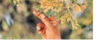
چرای دام و برداشت دانمهای بلوط اجازه نمیدهد جنگل خودش را بازسازی کند

میلیون هکتار در نظر بگیرید، ۴ میلیون هکتار آن مخروبه است و پوشش تاج در این مساحت، از ۲۵ درصد کمتر است.