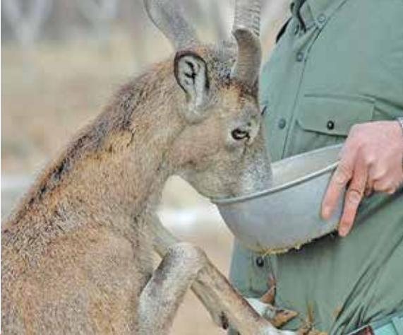
عکس تزئینی است

تا آب یا تابش آفتاب گرم نشده و همچنین به دلیل قرارگیری در بالادست و وجود شیب، آب شرب به سهولت مورد استفاده قرار گیرد. همه چیز خوب پیش می‌رفت و خدا را شکر دیگر مشکل آبی نداشتم. تا اینکه بعد از چند روز، برای آبیگری مجدد این تانکر اقدام کردیم. یکی از نیروها را برای بررسی داخل تانکر فرستادیم. اما در مدت زمانی کوتاه، همگی شوکه شدیم. داخل تانکر پیر بود از لاشه و اسکلت مار، مارها احتمالاً برای خوردن آب وارد تانکر شده بودند، اما همگی گیر افتاده و مرده بودند. شاید هم به دنبال موش وارد این تانکر شده بودند چون داخل تانکر چند لاشه موش