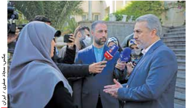
وزیر صمت در جمع خبرنگاران: پاسخ‌های قانع‌کننده‌ای برای مجلس خواهم داشت

وزیر امور خارجه خاطرنشان کرد: در امریکا علاقه به تبادل دارند و اما هم‌زمان از ترور آشوب حمایت می‌کنند ما در تأمین منافع ملی مردم از خطوط قرمز کوتا نمی‌آییم. وی با یادآوری این نکته که ایران در روزهای اخیر پیامی را از امریکا دریافت کرده است، اظهار داشت: از نظر ما مسیر دیپلماتیک ادامه دارد اما برخی مقامات امریکایی طوری حرف می‌زنند که متناقض