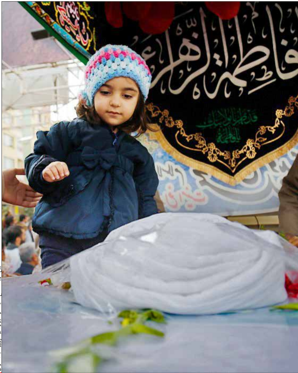
تشییع شهید مدافع امنیت در شیراز

دشمن یک امتداد داخلی هم دارد که آنها هم تلاش دارند با استفاده از روزنامه ها و فضای مجازی، القای یأس و ناامیدی بکنند