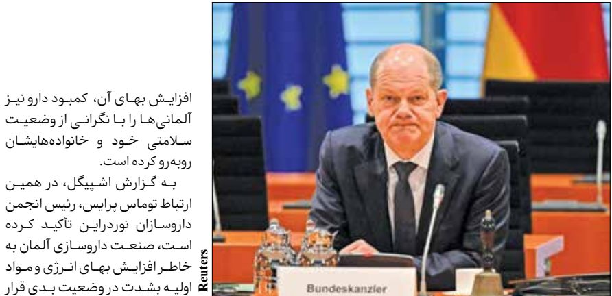
اواف شولتز یک سال نخست خود در کسوت صدراعظمی را با انتقادهای فراوان سپری کرد

لاله مهرزاد ، دولت آلمان بعد از تکاپویی که برای رفع کمبودهای گازی خود داشت، اعلام کرده، توانسته است ذخایر گازی کشور را پر کند. اما این خبر هنوز هم خیال آلمانی‌ها را آسوده نکرده است. زیرا هم‌زمان با خبرهای خوش دولت، برخی مقامات آلمانی به شهروندان هشدار داده‌اند، ممکن است این زمستان مجبور به تحمل خاموشی و قطع برق باشند. در کنار آن گرانی مسکن و کمبود دارو نیز مزید بر علت شده تا مشکلات آلمانی‌ها افزایش قابل توجه یابد. به گزارش آسوشیتدپرس، رالف تیسلر، رئیس اداره حفاظت شهروندان و امدادرسانی در بلایای طبیعی در آلمان در مصاحبه‌ای با روزنامه آلمانی ولت ام سوناگ اعلام کرده است: «انتظار می‌رود آلمان در زمستان امسال دچار خاموشی‌هایی شود.» او تأکید کرده، «دلیل این