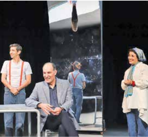
عکس تزئینی است

تاریخی دارد چون نویسنده مولد و زایشگر حقیقی یک اثر نمایشی است و کارگردان مؤلف ثانی آن محسوب می‌شود که بنابر تحلیل و نگاه ویژه‌اش به هر متنی سمت و سو می‌دهد. این همان ماهیت دومی است که بر پایه ماهیت و چیستی یک درام یا متن ادبی شکل گرفته و تا آن اولی نباشد، این دومین قابل تصور نیست. بنابراین کارگردان نسل امروزی بی‌آنکه دچار توهم شهرت شده یا تکبر مانع از دیدن نام نویسنده یا از شگذاری برای نمایشنامه‌شود، بهتر است که همواره درک درست و بسامانی از اصول تئاتری داشته باشد تا بتواند به جای جبهه‌جایی نام‌ها و دستورهای پایه‌ای و بنیادین، بنابر ذوق و توان هنری اش، خود را در شکل یافتن یک اثر نمایشی اثبات کند، آن هم فارغ از اینکه دغدغه نام داشته باشد و بداند آنچه باعث خوشنامی و ماندگاری نامش خواهد شد همانا هنر و خلاقیتش است و نه بالا و پایین گذاشتن نام و حتی تبلیغات بیش از حد. بنابراین در یک روال عادی و بی‌سروصدا کیفیت حرف آخر را برای تعیین جایگاه راستین کارگردان رقم خواهد زد.